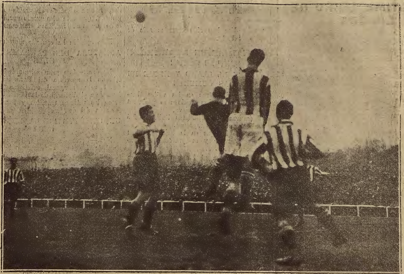
FUTBOL EN MADRID.—UN MOMENTO DEL PARTIDO DE CAMPEONATO DE PRIMERA CATEGORIA JUGADO ENTRE EL R. S. GIMNASTICA Y EL ATHLETIC

pa, sufro de una enfermedad única; tan sólo la intensidad de la dolencia varía según las regiones. Rusia sigue viviendo en pleno marasmo económico, contra el cual nada valen los cubileteos de sus gobernantes. Al cabo de un año de haber conseguido, a duras penas, estabilizar su moneda y equilibrar su presupuesto, Polonia vuelve a caer en la confusión y el desorden financiero. Francia se ve obligada a sostener luchas heroicas—cuyo resultado es, aún más que dudoso, para evitar que el franco se hunda definitivamente. La vida económica de Inglaterra está caracterizada por un cierto grado de estancamiento crónico expresado en la cifra, casi invariable desde hace varios años, de un millón y medio de obreros en paro forzoso. En Suecia, en Suiza, las industrias exportadoras vegetan en estado anémico. Y así sucesivamente. Una enumeración completa sería de todo punto superflua. Se trata de una regla sin excepción.