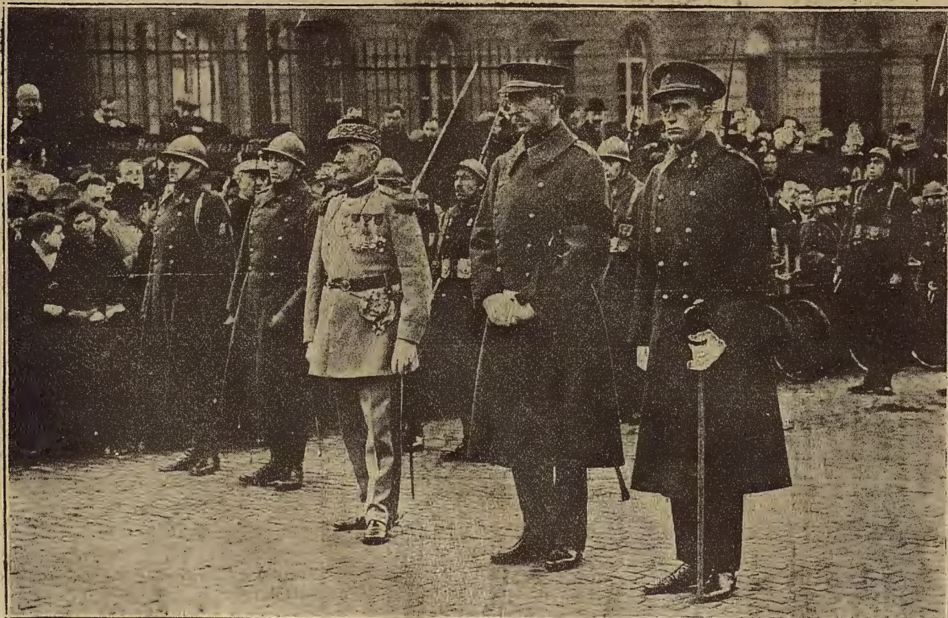
BRUSELAS: ENTIERRO DEL CARDENAL MERCIER, EL REY DE BELGICA, CON EL PRINCIPE HEREDERO Y EL MARISCAL FOCH, PRESIDENDO EL DUELO.