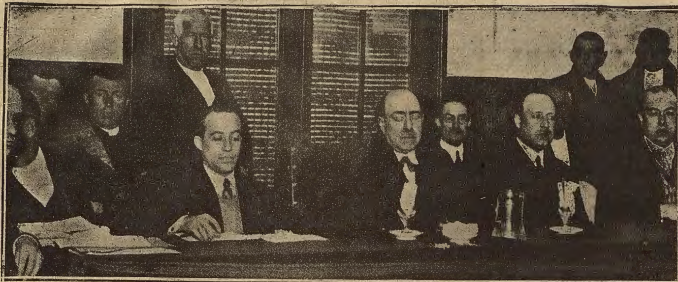
Mesa presidencial de la asamblea de remolacheros celebrada el domingo en Zaragoza