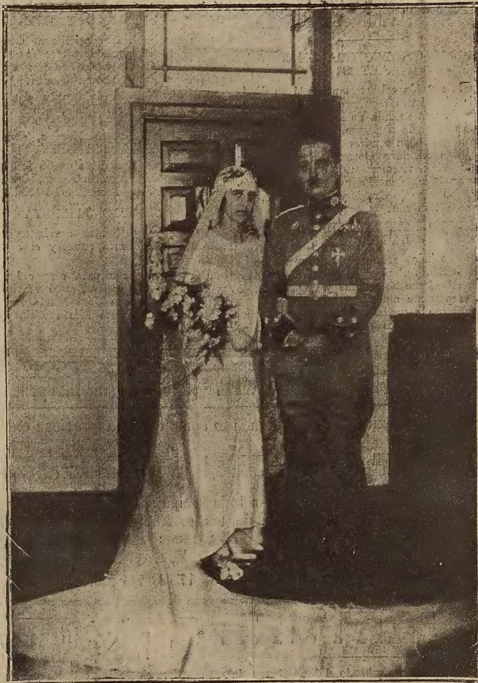
UNA BODA ARISTOCRÁTICA EN SAN SEBASTIAN.—El conde de Isla y la marquesa de Murúa, emparentados con ilustres familias aragonesas. Fotografía hecha momentos después de su enlace matrimonial

Este número ha sido sometido a la previa censura