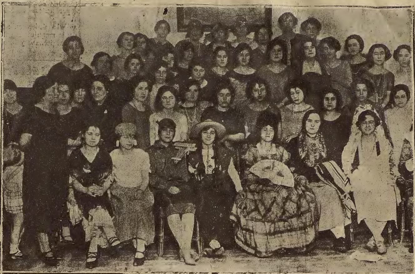
EL ARNAVAL EN ZARAGOZA.—Señoritas que concurrieron al baile organizado por la Colonia Vasco Navarra.

Para informar a nuestros lectores de cuanto ocurre en Madrid, provincias y extranjero, celebramos varias conferencias telefónicas diarias con Madrid, Barcelona y San Sebastián.