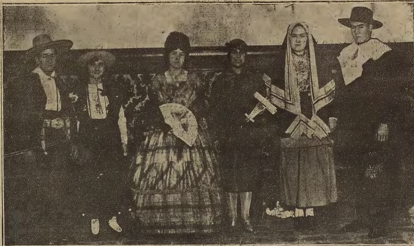
EL CARNAVAL EN ZARAGOZA.—Máscaras premiadas en el baile que celebró la Colonia Vasco Navarra el domingo por la tarde.