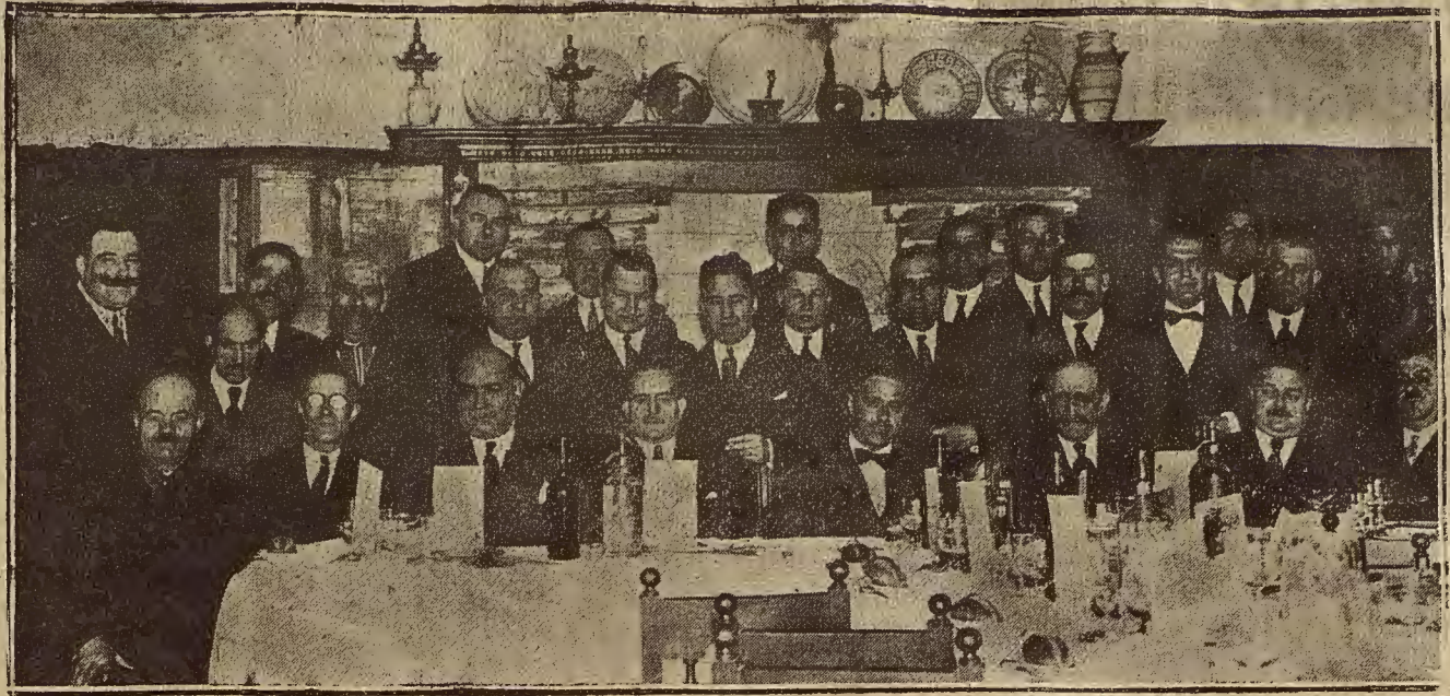
Del banquete con que los vecinos del barrio de San Pablo han celebrado la prosperidad de la asociación que venían constituida

Adaptación cinematográfica de la bonita zarzuela de Arniches y Jackson Veyan