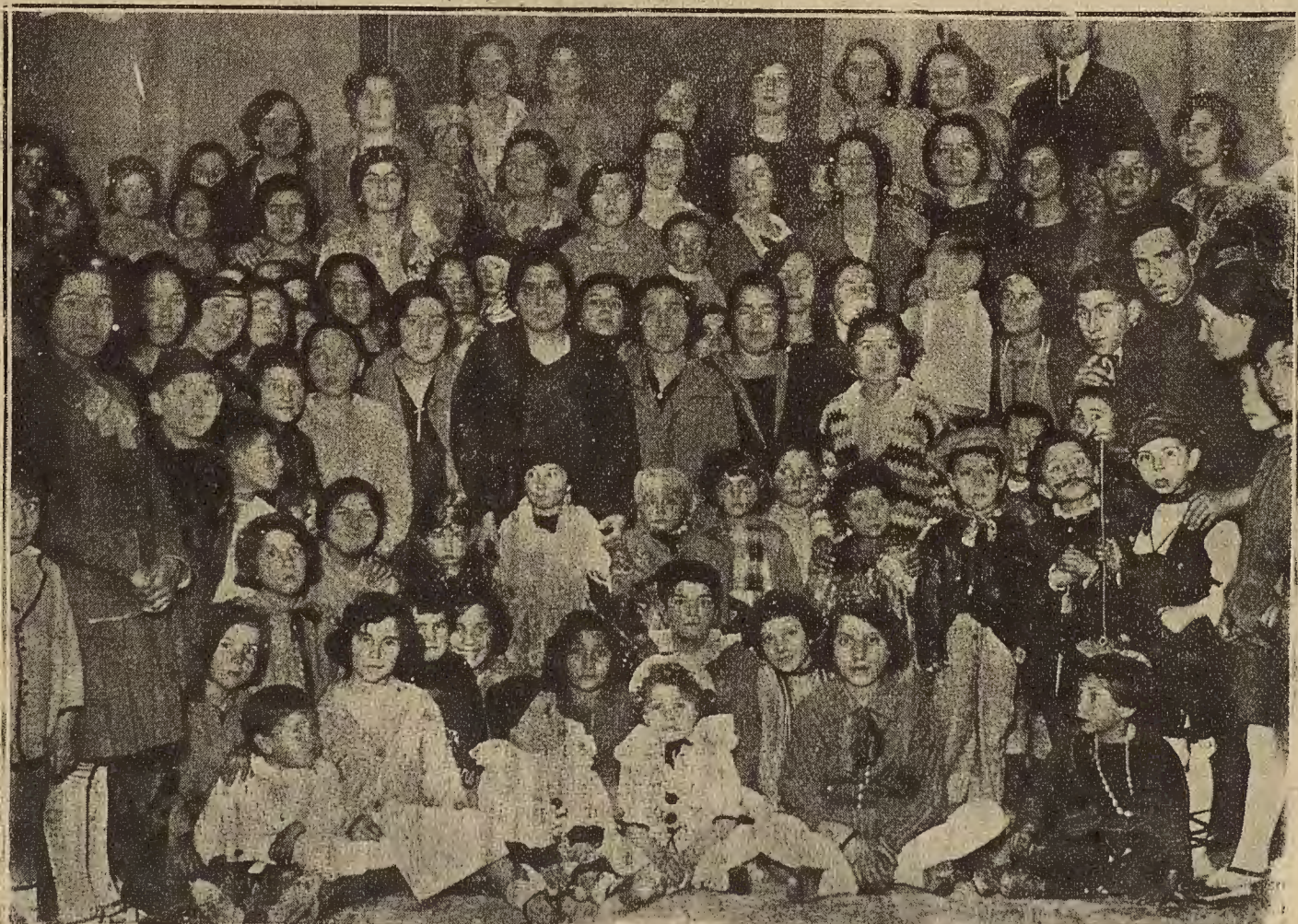
EL CARNAVAL EN ZARAGOZA.—Señoritas que asistieron el domingo de Piñata al baile dado en el Circo Artístico Musical de las Delicias

Reina gran expectación por oír cantar a esta triple de Torralba de Aragón, que tan