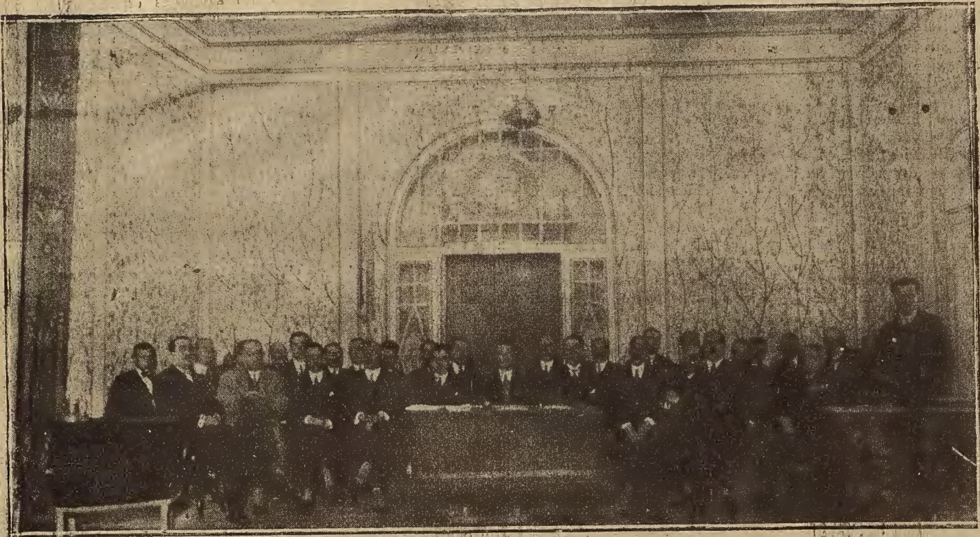
BARCELONA.—Mesa presidencial de la Asamblea de Viticultores de España, celebrada en el teatro Poliorama el domingo último.