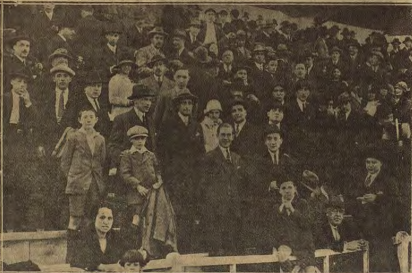
DEL PARTIDO DE FÚTBOL DEL DOMINGO.--Un aspecto de la numerosa concurrencia que presenció el encuentro, Athletic-Iberia.

Los ibéricos, en una reacción, llegaron ante la meta de Eraso, interviniendo la defensa atlética para despejar la difícil situación creada.