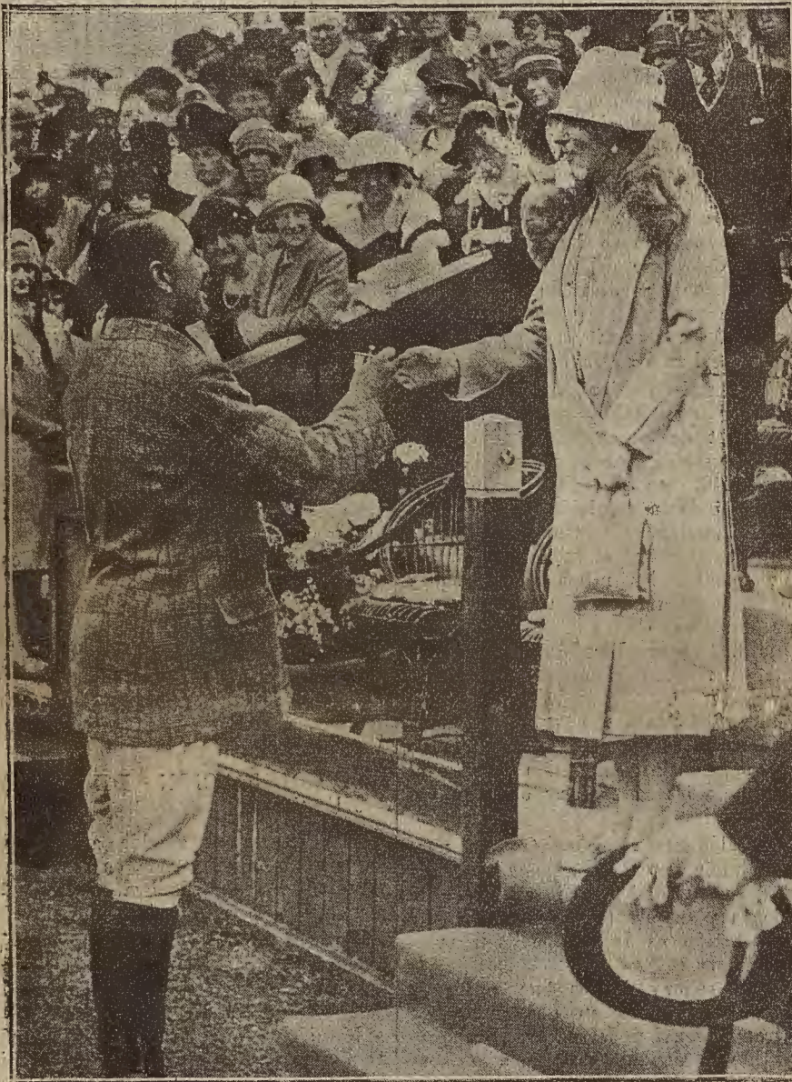
LA REINA DE ESPAÑA EN LONDRES.—Doña Victoria entregando los premios a los ganadores del partido de polo jugado en el campo del Hurlingham Club entre el equipo inglés y el equipo argentino.