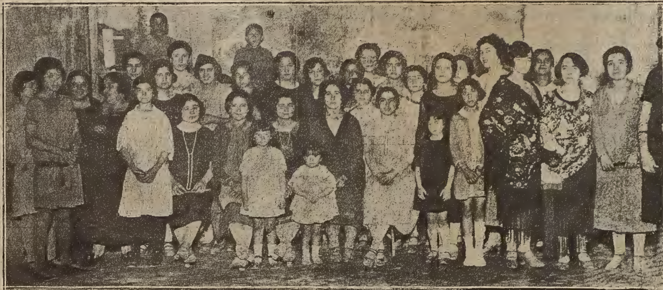
LAS FIESTAS DEL BARRIO DEL AZOQUE.—Señoritas que acudieron a la verbena celebrada en los Campos Elíseos.

borozo, con lo que el camino de pasión se trocará en camino de triunfo.