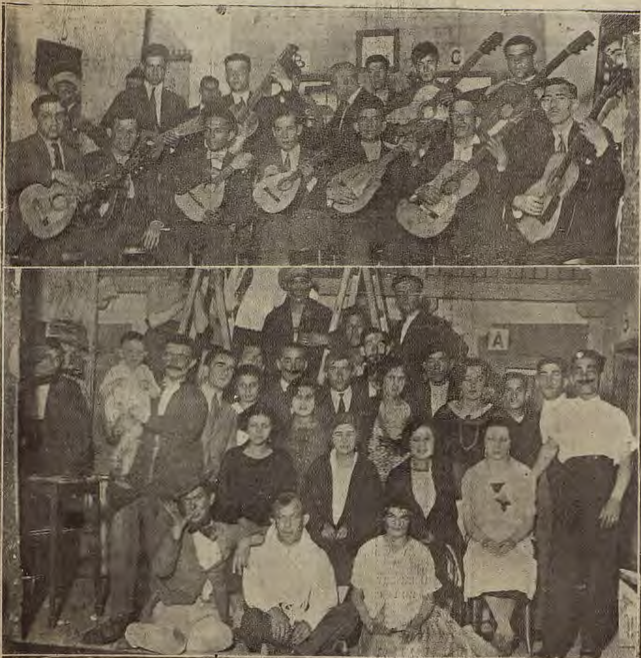
LAS FIESTAS DEL BARRIO DE LAS DELICIAS. —Arriba, la rondalla del barrio, que amenizó los intermedios en la velada que se celebró en el Centro Agrícola. Abajo, cuadro artístico de las Delicias, que tomó parte en el festival.

más modestos que todo eso. Bastaría con que habilitasen esas estrechas casitas de estrechas ventanas por donde ni la luz ni el aire apenas pueden entrar y en cuyas habitaciones la limpieza brilla por su ausencia. Con muy poco trabajo podrían poner esas grandes salas de suelo de losa en pequeñas habitaciones confortables, dignas de que las ocupase cualquier familia de la ciudad. Al que esto escribe se le ha dado el caso de buscar una casa para ocuparla una distinguida familia, la cual estaba encantada de aquel país, y fuese como fuese quería pasar unos días. No habrían transcurrido cuarenta y ocho horas cuando mis amigos vinieron a despedirse porque las gentes del país no tenían ni siquiera ligera noción de lo que es limpieza, (ya no digo higiene), saliendo por la noche abundantes huéspedes indeseables; he de advertir que se trataba de una vivienda que aparentaba un buen aspecto. Creemos que es un factor importantísimo el poder ofrecer un alojamiento decente al visitante.