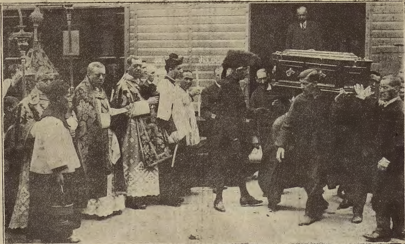
MADRID: ENTIERRO DEL MARQUES DE VILLALBAR, EMBAJADOR DE ESPAÑA EN BRUSELAS.—Momento de sacar e féretro del féretro que lo trajo desde Bruselas

Los mejores y más brillantes se expenden en la calle PIGNATELLI número 3. Venta directa del cosechero al consumidor.