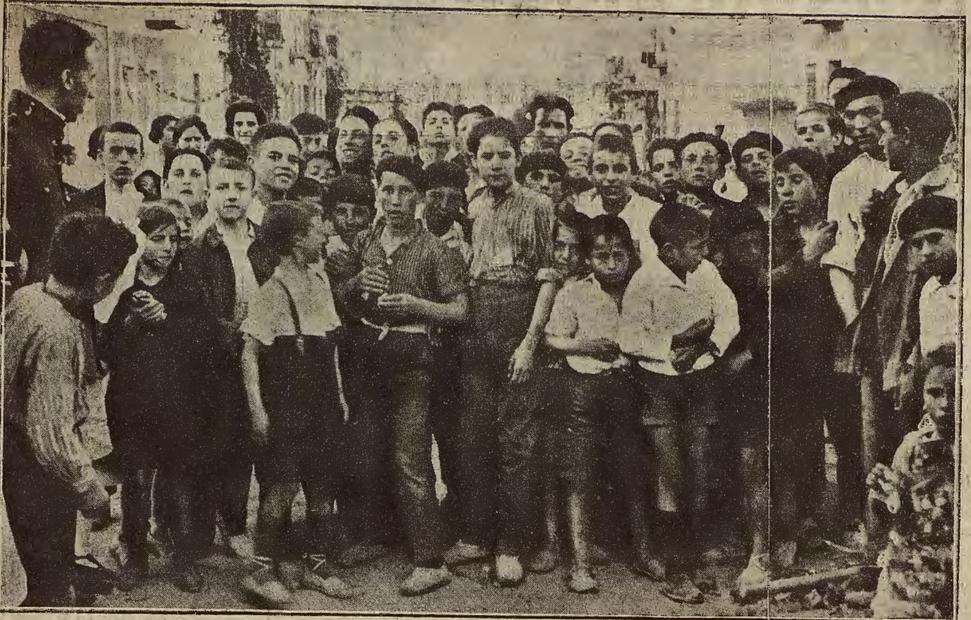
LAS FIESTAS DEL BARRIO DE HERNAN CORTES.—La carrera pedestre celebrada ayer tarde. Los corredores, momentos antes de salir (Foto Al. de la Barrera).

Otro autorizando a la Compañía Telefónica para el corte de ramas en algunos árboles del paseo del Ebro.