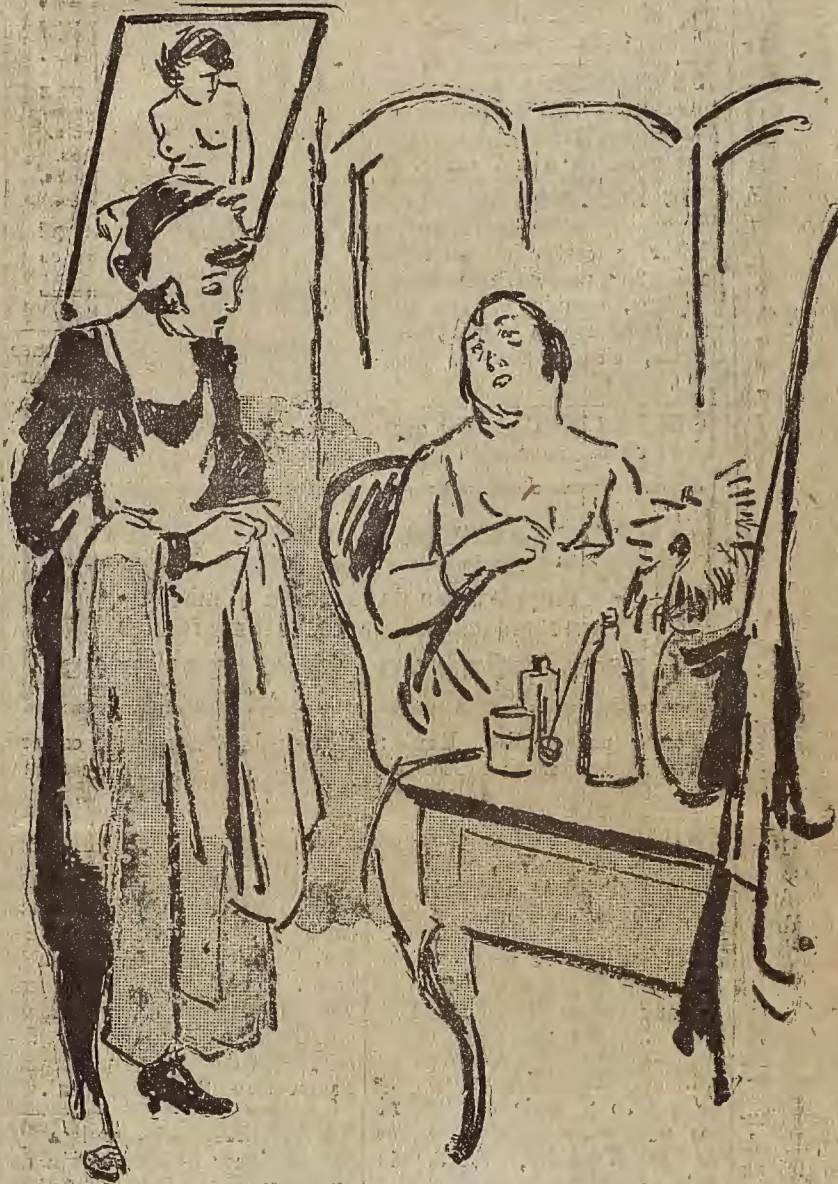
LA MODA, SEGUN LAS HORAS

Pero resulta que algunos empleados de Correos de Orán tienen cinco y seis mujeres cada uno, con un promedio de cuatro hijos por mujer. Y a consecuencia del subsidio providencial hay ahora carteros que ganan tres y cuatro veces más que el mismo jefe de Correos, mientras el Gobierno, sin saber qué hacer, trata de encontrar la solución del conflicto que este estado de cosas le ha creado.