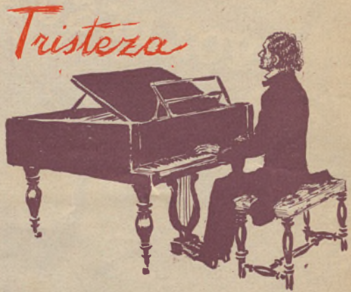
Chopin al piano

RAFAEL MEDINA con acompañamiento de orquesta