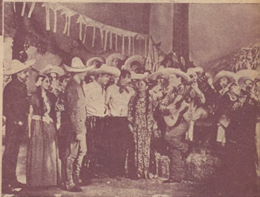
Una escena de ¡Ora Ponciano!

Tú ya no soplas. Corrido. } Palomita. Corrido . . . . } 203.690 QUINTETO TROPICAL } Odeon