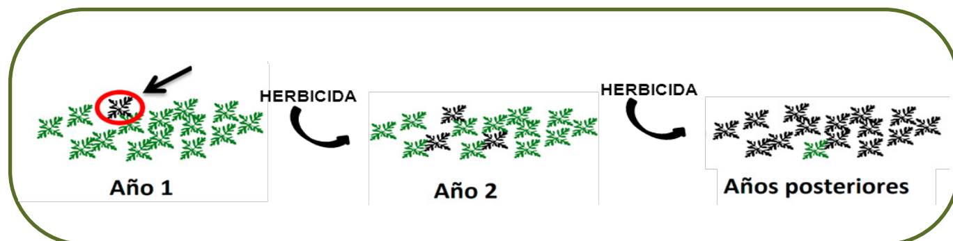
Figura 3: Esquema de como el número de malas hierbas resistentes (planta en negro) va aumentando progresivamente en la parcela tras aplicar el mismo modo de acción de herbicida, estamos seleccionando la población resistente con nuestro manejo (Royuela M. 2014).

Más información ( https://semh.net/grupos-de-trabajo/cprh/ ).