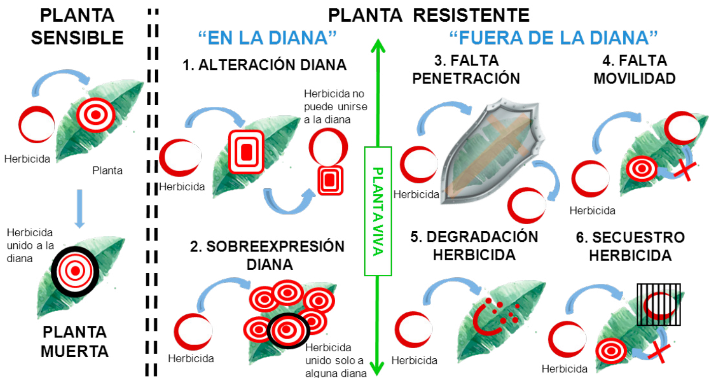
Figura 2: Una planta se hace resistente a un herbicida cuando altera el sitio de acción (diana) y el herbicida ya no le afecta (1) o cuando multiplica la diana por lo que el herbicida sólo le afecta parcialmente (2). Otros modos son: alterar la cutícula de la hoja y ésta se impermeabiliza al herbicida (3), impedir que éste se mueva dentro de la planta (4), degradarlo en componentes inocuos (5) o secuestrarlo en vacuolas para que no llegue a su destino (6).