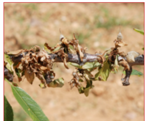
Daños de monilia en almendro

La floración es el periodo más crítico en esta enfermedad, ya que es la fase en la que el almendro y los frutales de hueso, en especial el albaricquero, pueden sufrir las primeras infecciones que provocan inicialmente la muerte de flores y después la de brotes. Al igual que en la mayoría de las enfermedades, las condiciones climáticas son decisivas para el desarrollo de la monilia. No obstante, la realización de tratamientos dependerá, además de dichas condiciones climáticas, del estado de cultivo, la especie y la variedad. En caso de ser necesaria la aplicación de tratamientos, éstos deberán centrarse en proteger el cultivo desde la apertura de las primeras flores hasta la caída de los pétalos. Los productos autorizados para la lucha contra esta enfermedad vienen indicados en el Boletín N° 1.