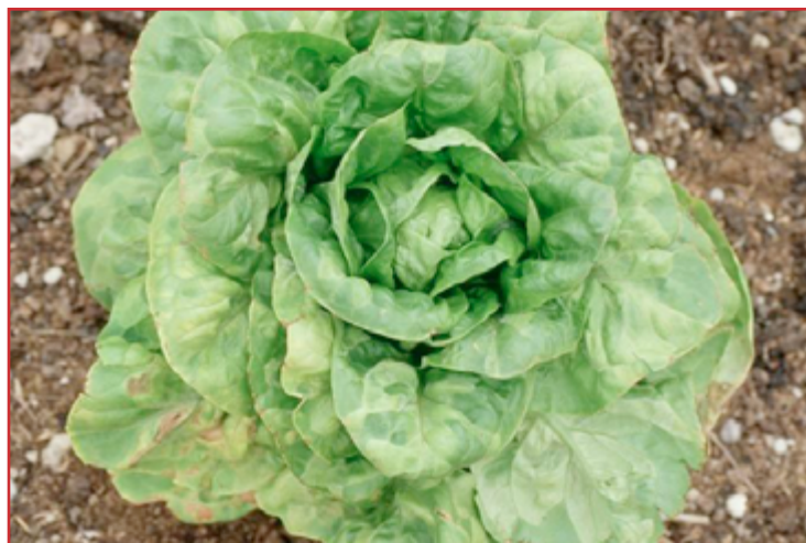
Daños de mildiu en lechuga

Para su control se recomienda utilizar semillas sanas, evitar encharcamientos, no plantar demasiado profundo, facilitar aireación, regar en días soleados, retirar restos de cosecha del cultivo anterior, tratar previamente cuando se prevean o produzcan las condiciones descritas anteriormente y antes de la aparición de las primeras manchas. El tratamiento se realizará antes de que cierre el cultivo, mojando bien toda la planta, con los productos fitosanitarios autorizados.