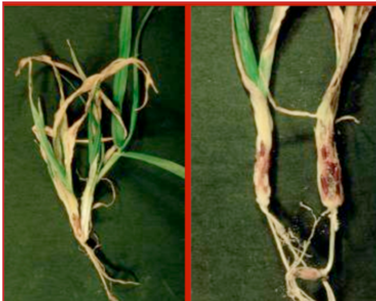
Daños ocasionados por el mosquito del cereal