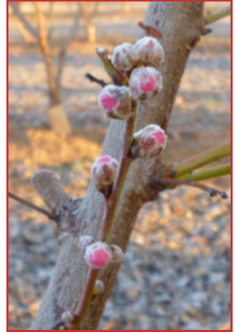
Estado fenológico D

Puesto que los pulgones son los vectores más importantes en la transmisión de enfermedades causadas por virus como el de la sharka (Plum pox virus), en las zonas donde está presente esta enfermedad, como las comarcas de Bajo Aragón-Caspe y Matarraña, es imprescindible realizar el tratamiento que se indica en los anteriores párrafos, de la manera más precisa posible.