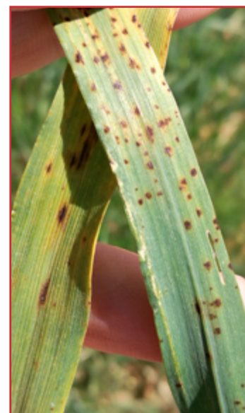
Daños en hoja de Pyrenophora teres

Se podrán utilizar los productos fitosanitarios autorizados en el Registro de Productos Fitosanitarios del Ministerio de Agricultura, Alimentación y Medio Ambiente.