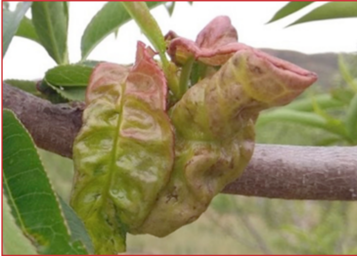
Daños de abolladura en melocotonero

A partir del estado fenológico B (las yemas de los ramos mixtos comienzan a hincharse), los melocotoneros y nectarinos son sensibles a esta enfermedad, en especial si se dan las condiciones climáticas adecuadas para su desarrollo, esto es, humedad relativa elevada y temperatura fresca.