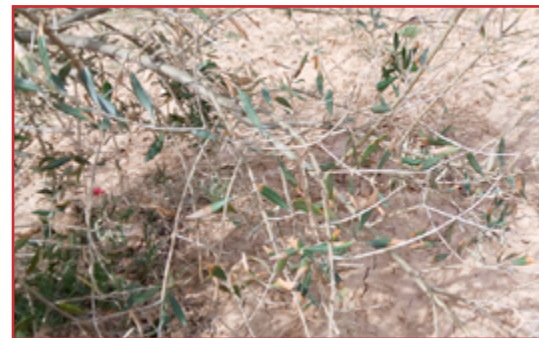
Daños por helada

Se recomienda por tanto que, en el proceso de la poda, se eliminen las ramas dañadas debido a que las heridas son punto de entrada de hongos como tuberculosis. Una vez concluida la poda, se recomienda realizar un tratamiento con cobre, este tratamiento se aconseja aplicarlo en las horas centrales del día.