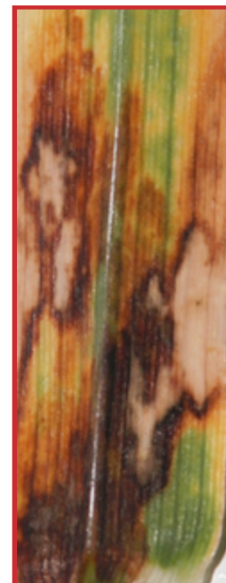
Daños en hoja de Rhynchosporium secalis