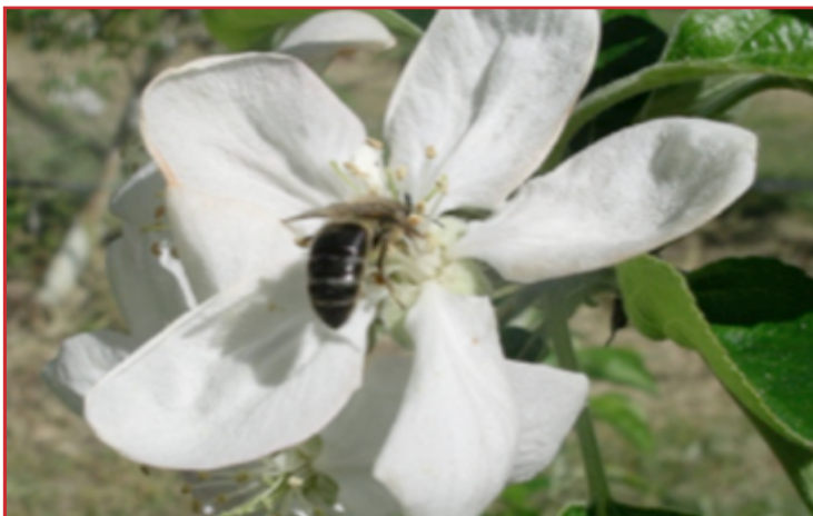
Abeja polinizando una flor de manzano

esta oviposición se puede aplicar caolín sobre el cultivo procurando el mayor recubrimiento posible. Otra estrategia para luchar contra esta plaga, es realizar entre 1 y 3 aplicaciones con alguno de los productos químicos que vienen indicados en el Boletín N° 1 para eliminar a los adultos de sila justo antes de que realicen la puesta. Estos tratamientos deberían realizarse en días soleados y con temperaturas superiores a 10 °C. El momento adecuado para iniciar estas aplicaciones se comunicará mediante un aviso a través del correo electrónico.