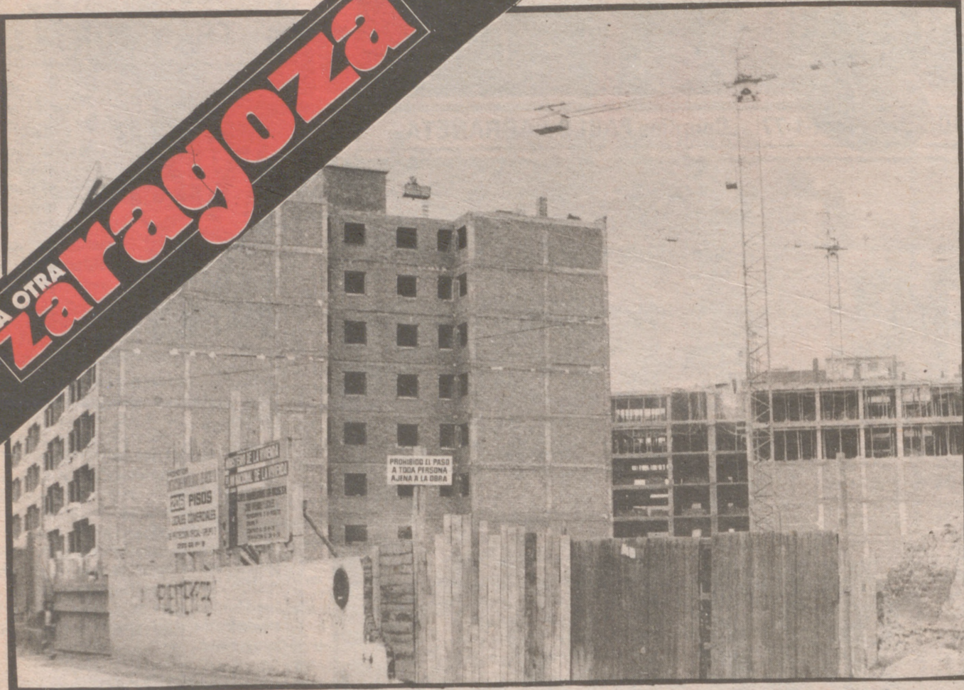
Las casas de los aljibes