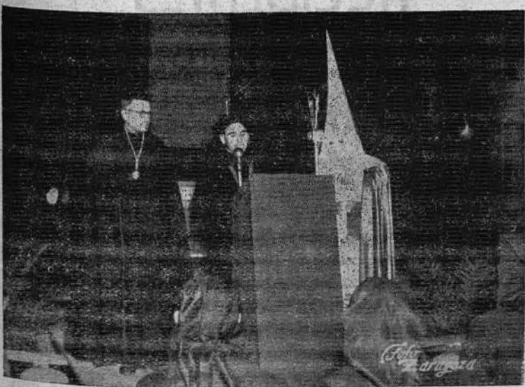
Nuestra Emisora Sindical retransmitió la lectura del Pregón con el que se iniciaban los actos de la Semana Santa. El equipo de altavoces o micrófonos de esta Emisora contribuyó a la mayor difusión y brillantez de los actos organizados.