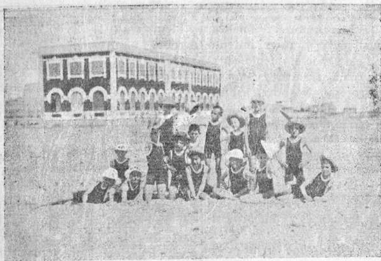
Al fondo, el Sanatorio de La Malvarrosa.