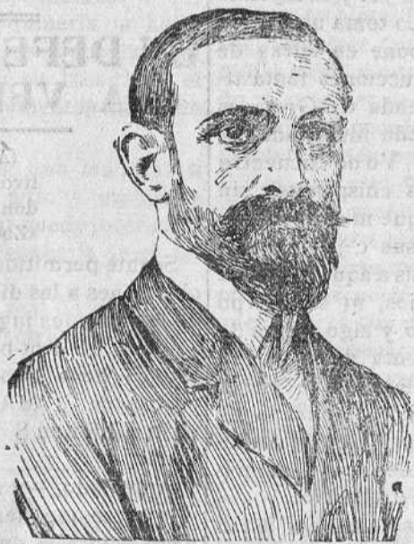
DON FRANCISCO CAMBO, «LEADER» DE LOS REGIONALISTAS CATALANES Y EXMINISTRO, CUYAS NOTAS CONSTITUYEN LA ACTUALIDAD POLITICA.