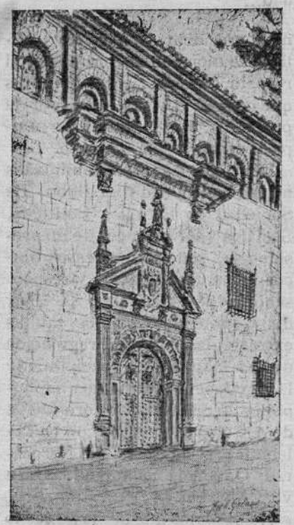
La magnífica portada del Convento de Religiosas de Santa Clara. (Dibujo de J. E. Gallana).