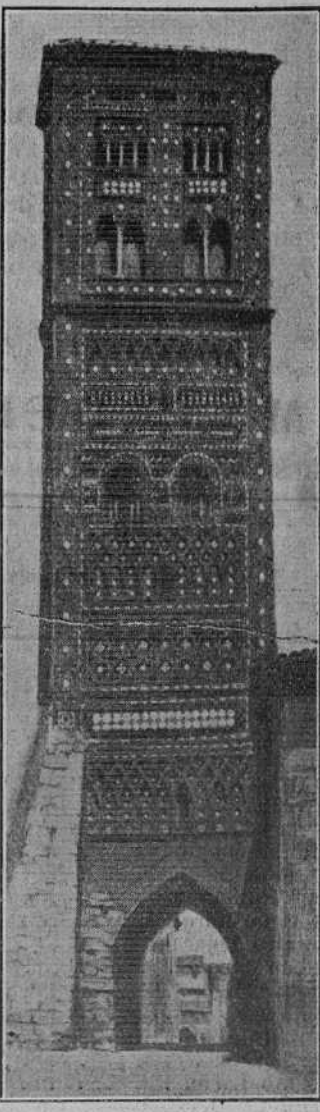
Bella torre mudéjar de San Martín. Entre los admirables dibujos del ladrillo surge el alegre chisporroteo multicolor de las cerámicas. Prodigio de equilibrio y majestad, que cierra el horizonte de la más turolense de nuestras calles, la de los Amantes. —(Cuadro de Novella).

Hay que combinar la acción de la Junta local con la del S. I. P. A. del que va a constituirse en breve una sección en nuestra ciudad; hay que cuidar con verdadera minuciosidad de nuestros monumentos. Recientemente se ha sal-