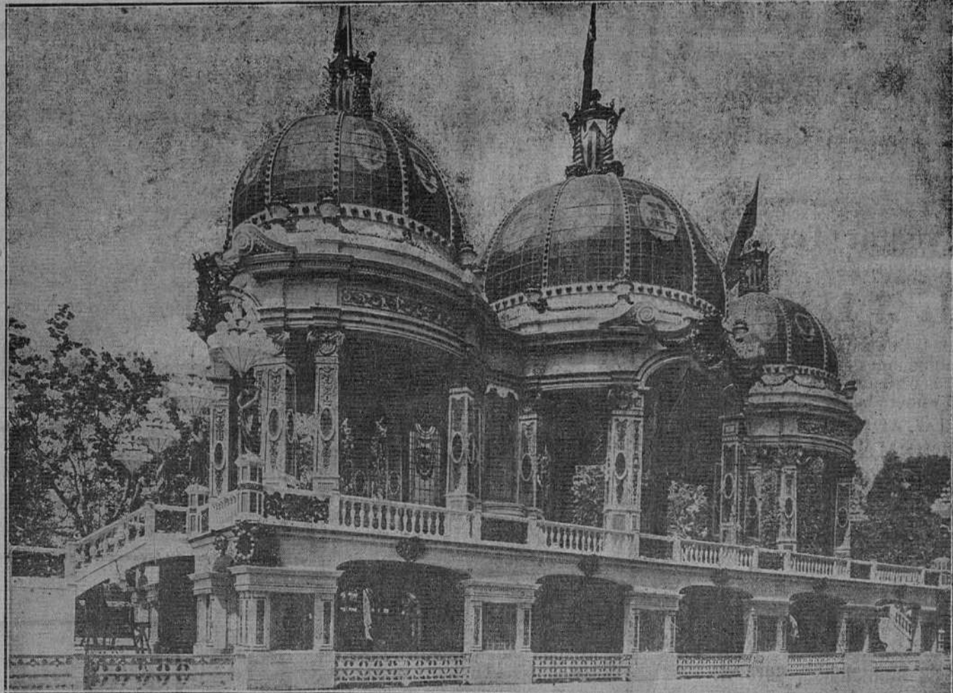
VALENCIA.—Pabellón que instala el excelentísimo Ayuntamiento en el paseo de la Alameda y en el cual se celebran aristocráticos bailes y fiestas de sociedad. Su bella arquitectura luce sus galas en el nocturno levantino en donde sus cúpulas y pilastras de cristales dorados y policromados muestran al mundo las exquisiteces del arte valenciano. Su coste asciende a 250.000 pesetas.