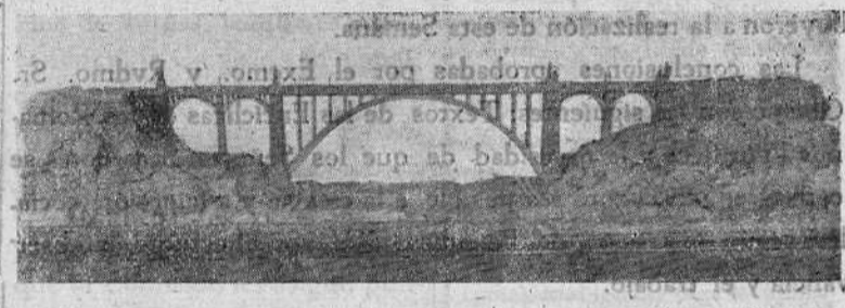
Interesante maqueta del Viaducto presentada en la II Exposición Provincial de Artesanía.