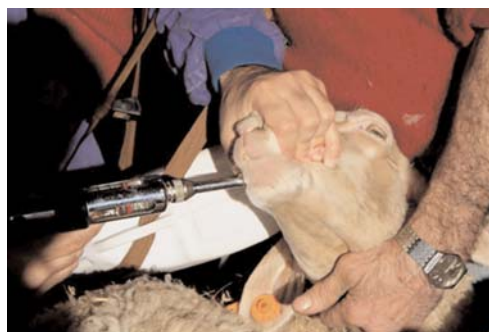
Administración del antihelmíntico durante la realización de un ensayo en campo.

En multitud de ocasiones es fácil comprobar que no es necesario el uso de antiparasitarios en algunos rebaños; las ovejas que pastan en áreas de secano, por ejemplo, frecuentemente presentan niveles bajos de parasitación que son compatibles con la producción, por lo que estas ocasiones no es necesario su control. Así, a modo ilustrativo, al analizar los datos históricos de una Asociación de Defensa Sanitaria de ovino y caprino de la provincia de Huesca en la que se llevan diez años realizando análisis coprológicos en primavera y en otoño, se ha podido concluir que en el 45% de los casos no fue necesario realizar tratamientos antiparasitarios por la ausencia total de huevos de parásitos en las heces.