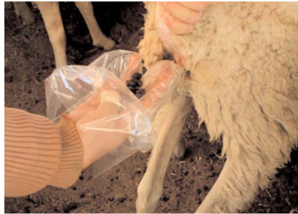
Las heces se recogen directamente del recto del animal.

La magnitud del fenómeno es tan importante que en algunas áreas de producción de Sudáfrica las resistencias a los antihelmínticos han provocado el abandono de la actividad ganadera a consecuencia de la falta de rentabilidad debida a las pérdidas producidas por los parásitos gastrointestinales.