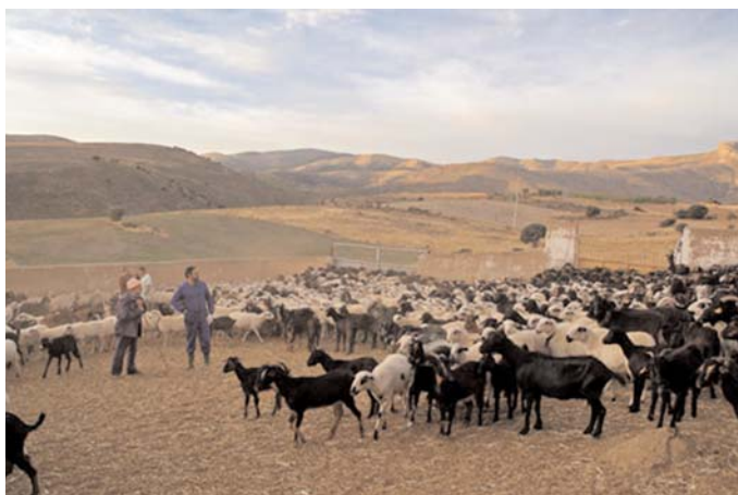
Toma de muestras en un rebaño.

Esta progresiva selección de las cepas de parásitos resistentes es más rápida con la práctica de tratamientos indiscriminados o aplicados inadecuadamente, favoreciendo el predominio y la expansión a medio y largo plazo de las cepas resistentes.