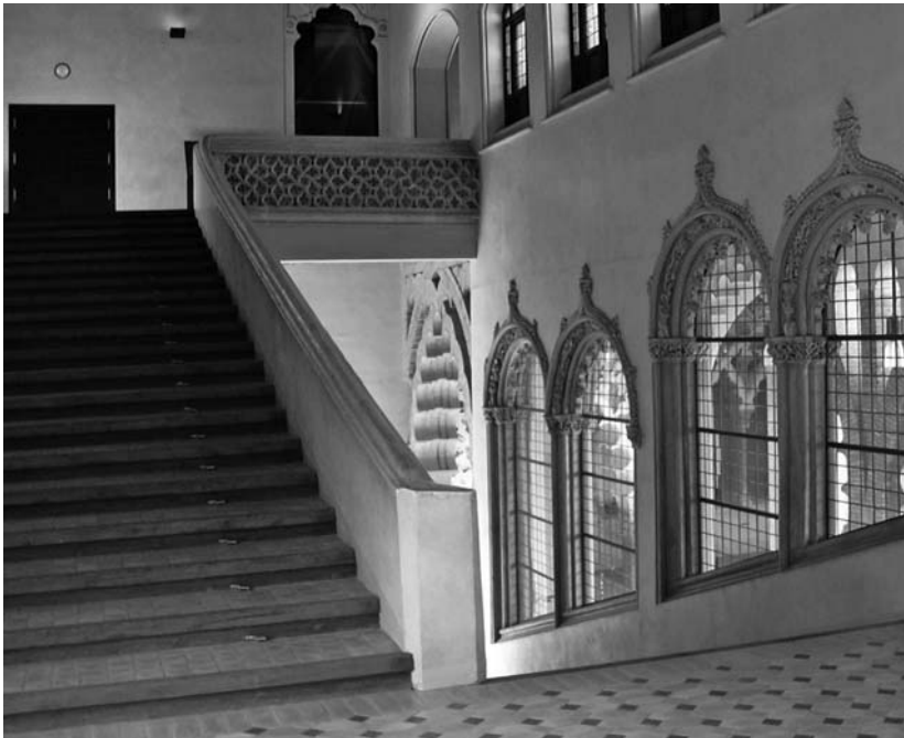
12. Escalera de los Reyes Católicos.

Fernando es un monarca al que las obligaciones en sus otros reinos, sobre todo en Castilla, le impiden una estancia continuada en los