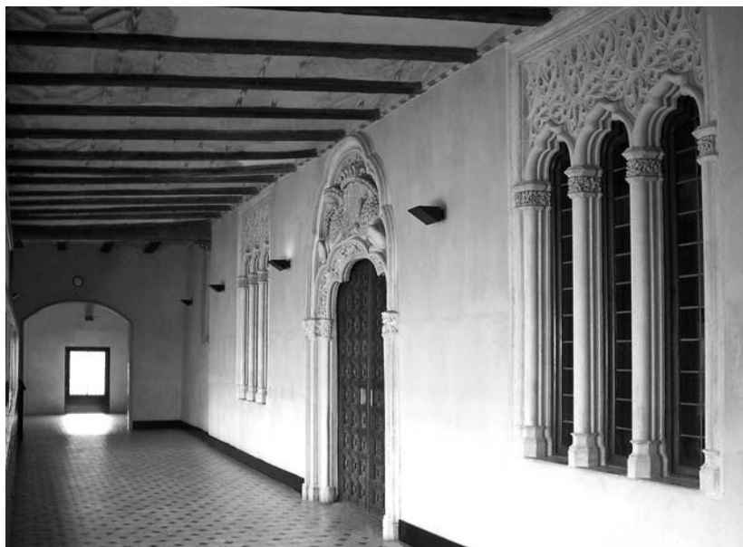
13. Galería de los Reyes Católicos.