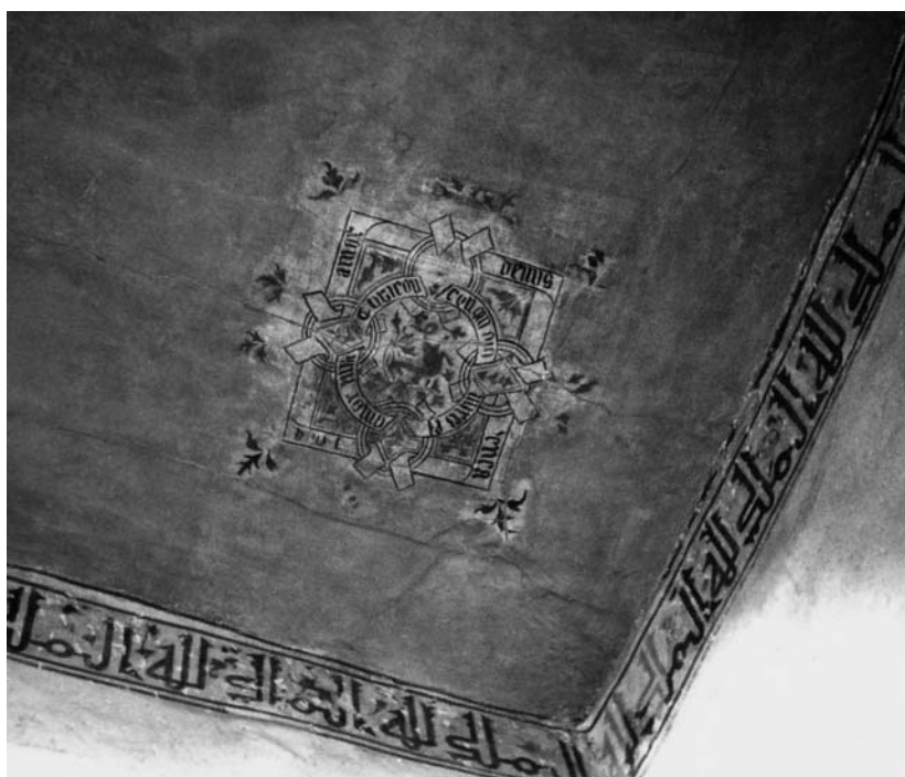
10. Decoración en planta tercera de la torre del Homenaje.

En 1593, en relación con la puerta del Socorro centrada en la cortina norte, se dice que por ella se podía salir a la huerta a caballo, y a