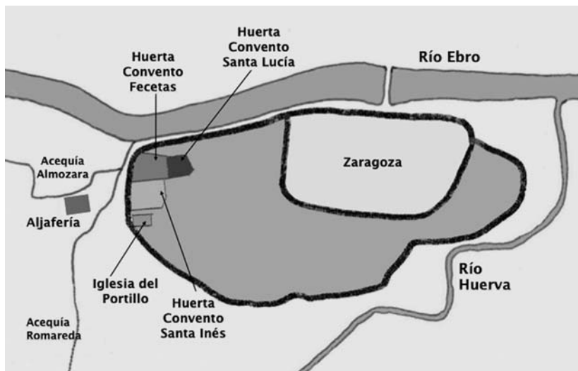
4. Croquis de Zaragoza.

En 1315 el rey ordena al merino Pedro Martorell que repare y acondicione los baños de la Aljafería antes de su llegada, y al año siguiente pide al maestro racional de la corona que admita en las cuentas presentadas por el merino los gastos de algunas obras realizadas en la cámara que está bajo la cámara mayor, en el mirador sobre el corral de los leones, y arreglos en un pórtico en la Aljafería, y también por un caballo para arrojar a los leones.