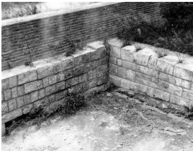
3. Aljibe Sur en el patio de Santa Isabel.