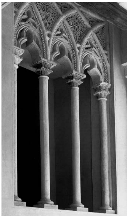
8. Ventana mudéjar.