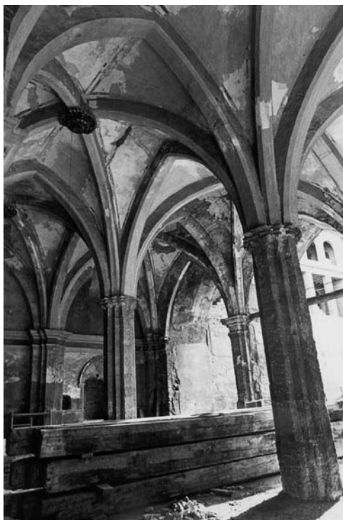
5. Capilla de San Martín.