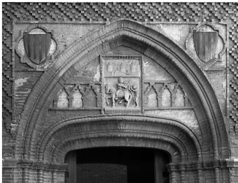
11. Portada de la capilla de San Martín.

partir del siglo XVII se dispone de referencias documentales escritas y gráficas que describen la llamada Huerta del Rey, establecen el sistema de arrendamiento y reflejan su perímetro, exterior al palacio.