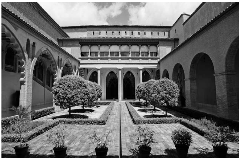
16. Patio de Santa Isabel.

El día 5 de enero de 1516 se suscribe un contrato entre mosén Juan de Soria, caballero, y Mahoma Gali, moro, maestro mayor de las obras de la Aljafería para la obra que se ha de hacer en la torre maestra o del Homenaje. En virtud de este contrato se ha de derribar la pared norte catorce palmos y volverla a levantar a la misma altura, y almenarla con un grueso en el medio de rejola y media y en los cantos de dos rejolas; se ha de derribar el tejado y subir la pendiente seis palmos más alto que actualmente está, con rollos cada seis palmos con sus vigas de doce palmos, enhojado con hoja castellana y cubrirlo con rasilla y teja; se han de derribar algunas almenas y hacerlas de nuevo, reparar otras y colocar ocho canales o gárgolas como las de la torre del Viento; se ha de derribar la torreta y subirla de una rejola a la altura actual, con su chapitel y asentar la manzana y la bandera; construir un banco alrededor de las almenas, reparar los tejados y acondicionar la escalera de la instancia más alta hasta el tejado. Los jornales que se pagarán por esta obra a maestros, mozos y peones, ascenderán a mil ochocientos sueldos jaqueses, pagaderos en tres veces, al comienzo, al medio y al final de dicha obra.