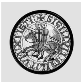
2. Escudo de la Orden del Temple.

Poco más tarde, en 1184, corroborando la importancia que se le concede ya al uso del agua en relación con la Aljafería, el rey concede a la Orden del Temple la acequia de Celtén, que llega a la Almozara y al palacio, con la condición de que mantengan el azud abierto y en condiciones y limpia dicha acequia hasta la Aljafería, determinando la alfarda a pagar y otras obligaciones.