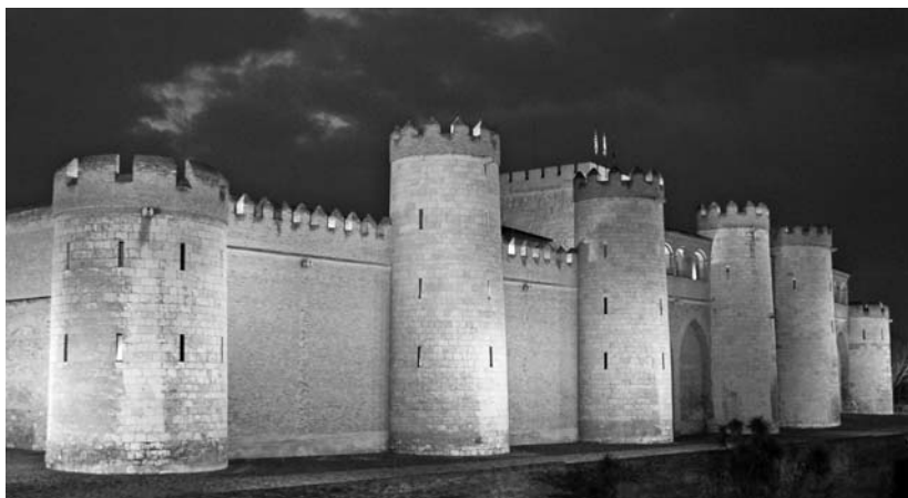
1. La Aljafería.