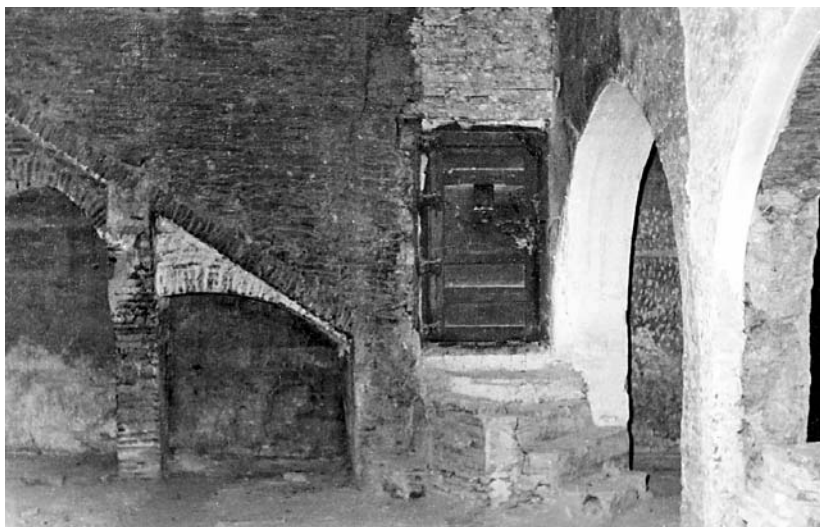
9. Planta quinta de la torre Mayor o del Homenaje.

el documento expuesto unas líneas más arriba, de abril de 1366, creemos poder despejar las dudas de que Allabar pudo trabajar en las torres Mayor y del Viento como sucesor de su maestro Jahiel Terrorer, a quien ya hemos visto como maestro de las obras de la Aljafería en enero de 1339.