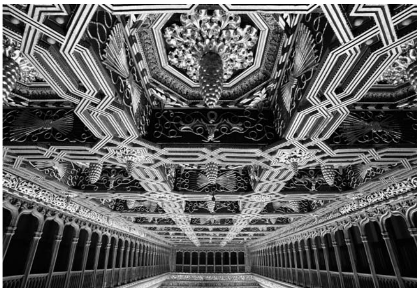
15. Alicer del salón de los Reyes Católicos.

El rey visita Zaragoza por última vez en 1510 aunque no es la última en que pisa territorio aragonés, puesto que en 1515 asiste a las cortes de Calatayud en las que una mayoría plantea la sustitución en la apelación a la justicia del rey por la de el justicia y su consejo.