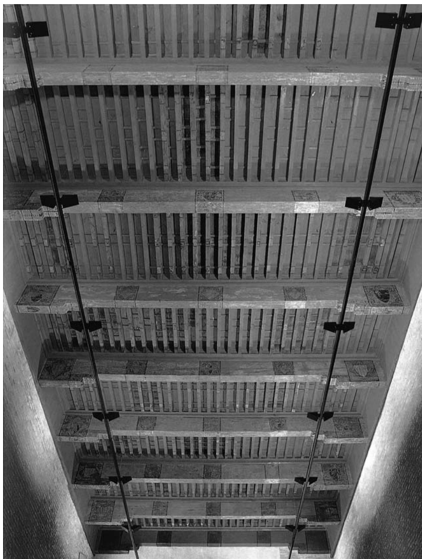
7. Techumbre del salón de Recepción.

El 7 de febrero Pedro IV encarga al baile general de Cataluña, Pedro Ça-Costa, el envío de doce columnas con sus basas y capiteles para doce ventanas de las habitaciones reales de la Aljafería.