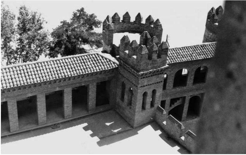
6. Torre de la capilla de San Martín.