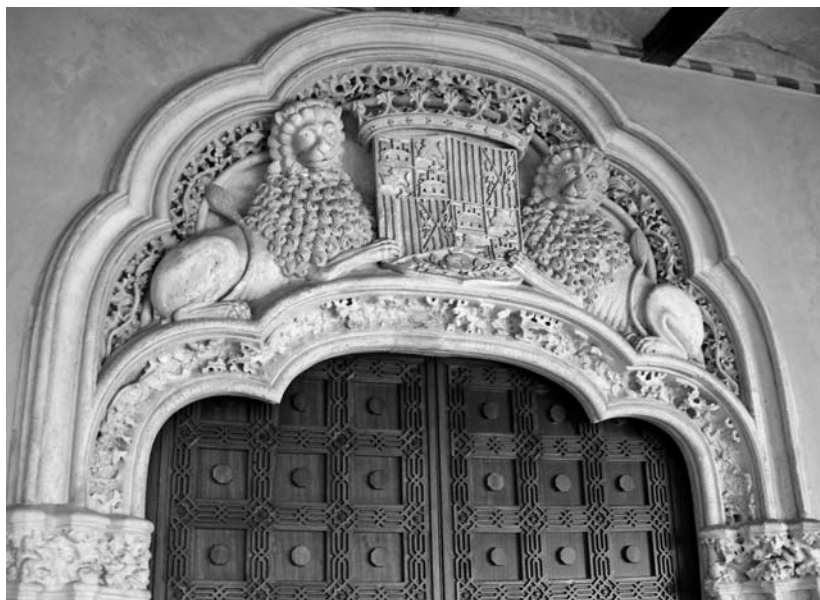
14. Puerta del salón de los Reyes Católicos.

No obstante, en este principio del siglo, a Zaragoza se le plantea nuevamente un problema sucesorio, con otra princesa como candidata, Juana, hija de los Reyes Católicos, desde 1496 archiduquesa de Austria por su matrimonio con Felipe, primogénito del emperador de Alemania Maximiliano, y madre desde hace poco del futuro emperador Carlos.