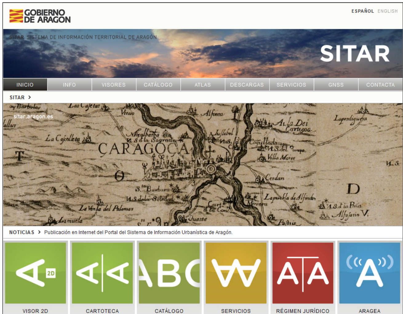
Sitio web del Sistema de Información Territorial de Aragón ( www.sitar.aragon.es )

y la Universidad que trabajan en ello garantizará la eficacia de futuros desarrollos. Es la filosofía general de DARA: intentar que el esfuerzo de