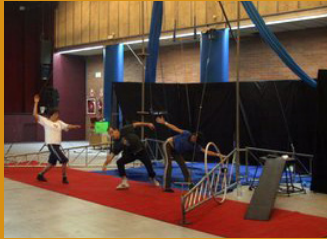
El circo, en Nou Barris, se ha convertido en una salida a la expresión de los artistas callejeros.

Vecinos de Nou Barris, decidieron entonces tirar abajo una fábrica que envenenaba su barrio. Sobre el solar, con espíritu abierto y participativo levantaron un ateneo popular. Luego vendrían los numerosos talleres y actividades con una escuela de circo y una política de integración de los nuevos inmigrantes a través de la acción social. Nou Barris agrupa a un conjunto de barrios que dan la espalda a la realidad urbana del centro y que no responde a los tópicos conocidos de la capital catalana. Los gestores del Ateneu, centro puesto en marcha hace 34 años, han llevado adelante un trepidante modelo de integración. Con similitudes del Faro de Oriente en México, en Nou barris se ha logrado extraer lo mejor de unos sectores con problemas de arraigo social y familiar. Y como ejemplo valga decir que han logrado poner en valor habilidades como las desarrolladas por los numerosos artistas callejeros de Barcelona.