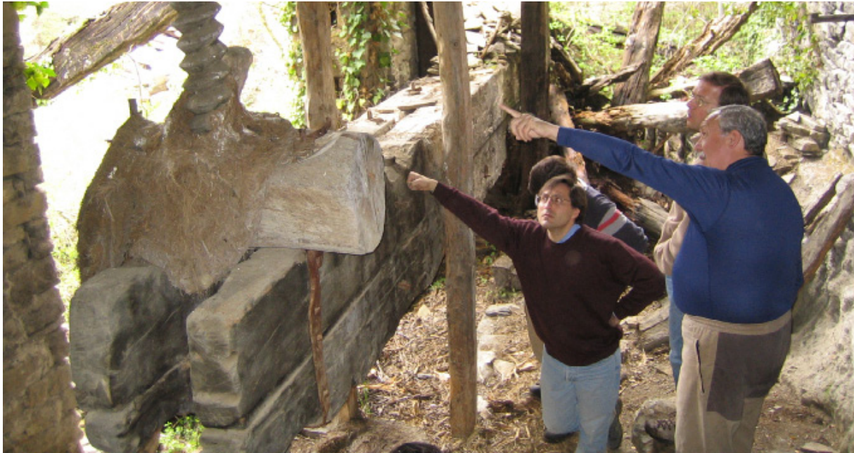
Los vecinos de la Fueva en una visita al molino en ruinas de Formigales.