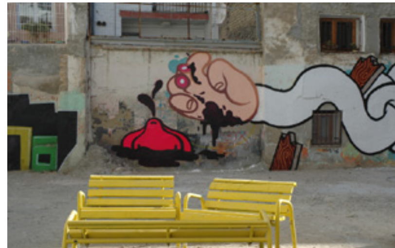
Solar de la plaza de San Agustín.

Su nombre no tiene evocaciones míticas como Lavapiés en Madrid, o el Raval barcelonés. Tampoco se le conoce como foco cultural al estilo de Coyoacán de México o el barrio de La Boca bonaerense. La Madalena, en Zaragoza, es el centro de una actividad cultural y artística que conjuga la cultura alternativa y de base con centros municipales como el Centro de Historias, donde además de una actividad expositiva y dinámica acoge el laboratorio de sonido para potenciar las producciones musicales. Pero en el corazón del barrio, protegidos por el mudéjar de la torre, surgieron hace pocos años todo tipo de propuestas creativas, ligadas al carácter singular y multicultural del barrio zaragozano. Multitud de locales, establecimientos y la propia calle dan cobijo a grupos y creadores que, con la dedicación de la Asociación de Vecinos Arrebato, se han convertido en foco cultural musical, artístico, audiovisual. En el espíritu del barrio están implicadas organizaciones, fundaciones, colectivos, centros educativos y el propio Ayuntamiento.