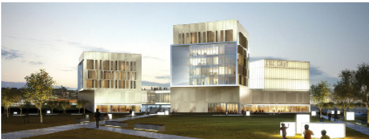
Recreación virtual del centro de Arte y Tecnología de Zaragoza, actualmente en construcción.