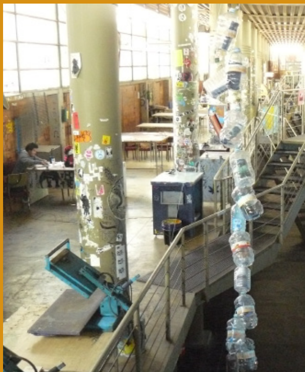
Imagen de uno de los talleres del Faro de Oriente de la ciudad de México.

Plaza de conciertos y salón teatral. En obras para ampliar el aforo a 15.000 personas. Por este escenario han pasado Los jubilados, Oscar Chavez, la Sonora Santaneca; La Maldita Vecindad, Los de Abajo, Botellita de Jerez, Zoe, la Castaneda, Santa Sabina o Panteón Rococó, entre muchos otros.