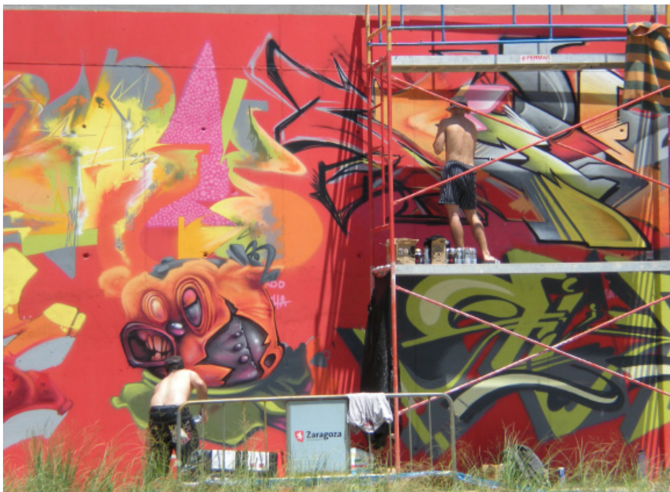
Arte en la calle. Pintura mural en una de las calles de Zaragoza.

extenso equipo de colaboradores en las principales ciudades de Iberoamérica y Europa. Scaramuzzino considera “que tiene que haber ayudas y subvenciones pero que no sirvan para aburguesar a la cultura”. “Está bien -añade- que las ayudas sirvan para sacar proyectos adelante pero no se deberían patrocinar al 100% “. El problema reside ahora -destacan expertos en la gestión cultural- en que pueden resentirse