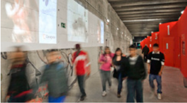
“El Túnel”, en el barrio Oliver de Zaragoza, ofrece sus espacios a los grupos musicales. Dani Marcos