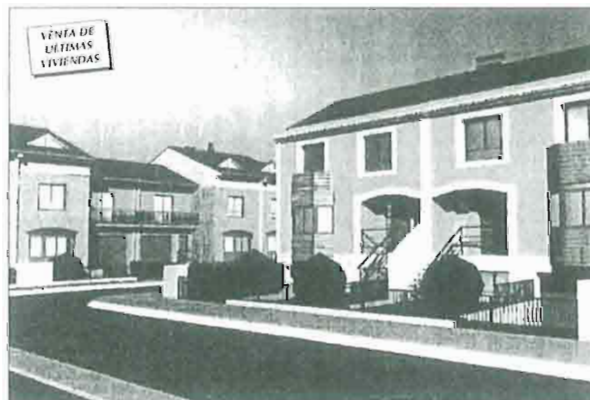
Urbanización «Residencial Vega de Luchina» Ejea