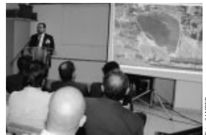
Explicación de la obra.

Caballeros un convenio de colaboración para compatibilizar los usos lúdicos de la estancia con los de riego.