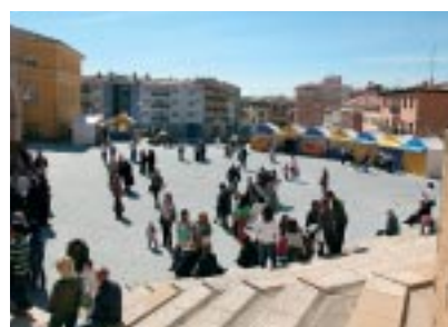
Feria de la Música.