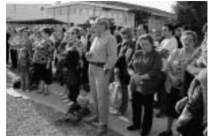
Vecinos de La Llana.