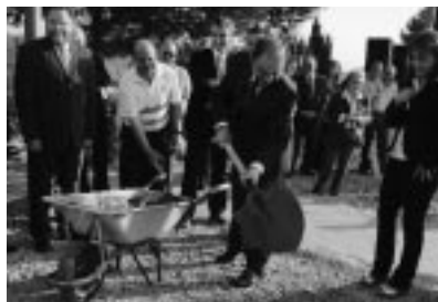
Momento de cubrimiento de la urna.