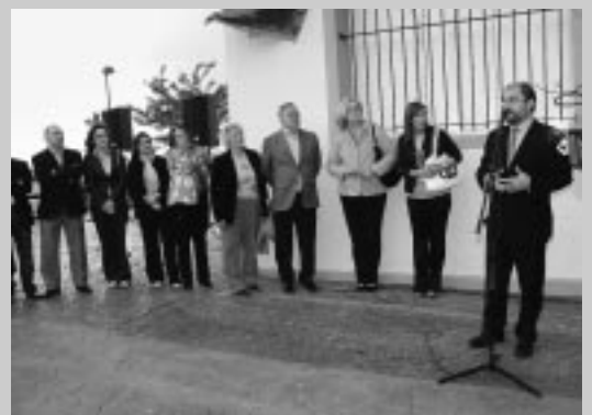
Acto inaugural de la Plaza Martín Berni.

También se visitó una actuación que ya está activa. Se trata de la nueva urbanización y zona ajardinada de la calle Gancho. En esta actuación han intervenido L2 Ingeniería, la empresa constructora Javier Arilla y la jardinería ha corrido a cargo de Jardinería Bardenas. Además, los responsables políticos visitaron el último tramo de la calle Gancho pendiente de urbanizar.