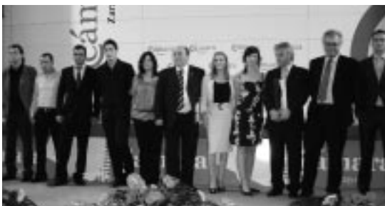
Equipo humano de Agromet Ejea.

La canalización de los más de 70 kilómetros de cable requeridos en la planta hizo necesario abrir 7.000 metros de zanjas. En las 108 cimentaciones de paneles solares se emplearon 3.250 metros cúbicos de hormigón y 119 toneladas de acero.