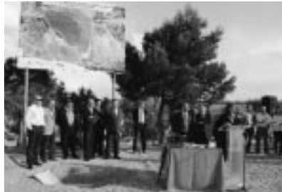
Intervención de la Alcaldesa de La Llana.

Para llevar a buen puerto el proyecto se ha contado con la inestimable colaboración de la Comunidad de Regantes de las Vegas, propietaria de la estancia del Gancho. Con ella firmó el Ayuntamiento de Ejea de los