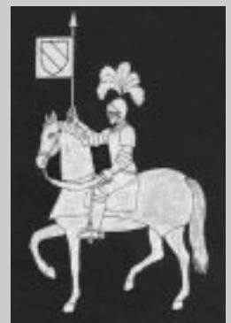
Escudo que aparece en las bandas de los Alcaldes de los Pueblos.

Este acto forma parte también del programa conmemorativo del 50º Aniversario de los Pueblos de Colonización de Bardenas. En el mismo pleno, se dará a conocer el conjunto de inversiones que, con cargo a los fondos de la Ley de Desarrollo Sostenible del Medio Rural, se van a desarrollar entre 2009 y 2011 en los seis pueblos de colonización de Ejea, que ascienden a millón y medio de euros. De esos fondos, el 80% será aportado por el Ministerio de Medioambiente y el Gobierno de Aragón y 20% restante lo aportará el Ayuntamiento de Ejea de los Caballeros.