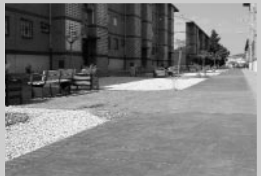
La calle Gancho con su nuevo aspecto. En la imagen de la izquierda, calle Bonifacio García Menéndez.