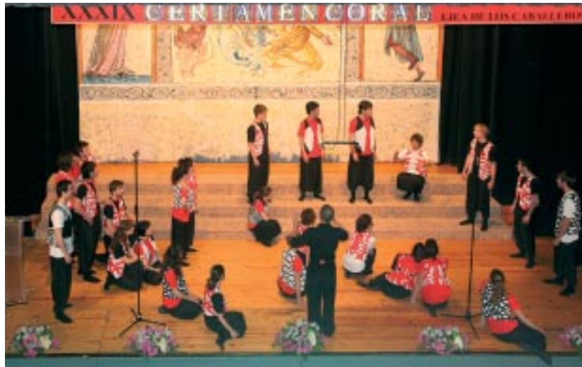
San Juan Bautista Abesbatza.

La novedad de esta edición es que el Certamen Coral de Ejea ha sido incluido dentro de los Festivales del Cuarto Espacio, contando con el patrocinio oficial de la Diputación Provincial de Zaragoza, sustanciado en la aportación de 50.000 euros. El patrocinador oficial de ediciones anteriores, la CAI, también sigue apoyando económicamente al certamen en este año 2009. Además de cuenta con el apoyo del INAEM (Ministerio de Cultura). Otros patrocinadores de los premios son: Comunidad de Regantes nº 5 de Las Bardenas, Imprenta Félix Arilla, Desmontes Caudevilla, Asociación de Empresarios de Comercio, Industria y Servicios de las Cinco Villas y Radio Zaragoza-SER Cinco Villas.