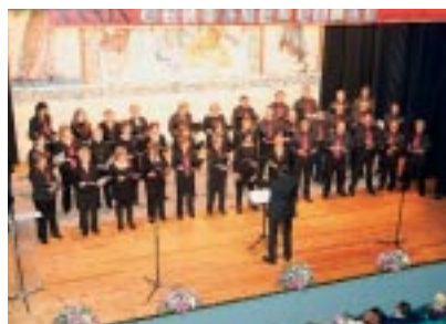
Coral Polifónica Ejea.