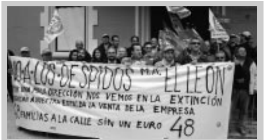
Concentración de los trabajadores de El León en la puerta del Ayuntamiento.

En el acto del Parque Central, tanto el Alcalde como Antonio Herranz, Secretario comarcal de la UGT, se manifestaron en el mismo sentido y exigieron al Gobierno medidas contra la crisis sin abaratar el despido ni recortar las políticas sociales.