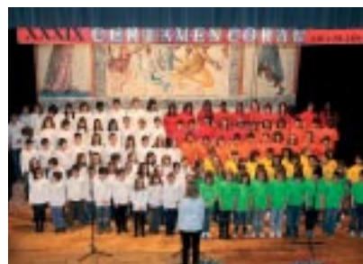
Coros del Cervantes y Mamés.