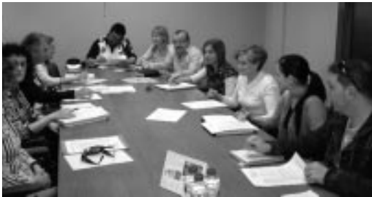
Comisión de zona sobre absentismo escolar.