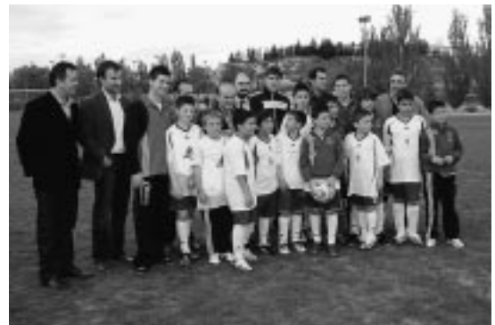
Los futuros futbolistas posan junto a responsables políticos y del Real Zaragoza.

El centro está dirigido a jóvenes futbolistas de edades comprendidas entre los 8 y 14 años en las categorías de: Benjamín, Alevín e Infantil. Los chavales siguen perteneciendo a sus respectivos clubes, ya que en el centro no se entrena equipos sino jugadores individuales. Las «asignaturas» son cuatro: técnica, táctica defensiva, táctica ofensiva y entrenamiento específico para porteros.