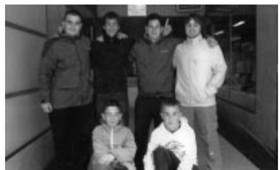
Miembros del Club Ajedrez Ejea.

Mención especial en este equipo merece la aportación de