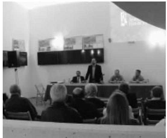
Momento de la reunión informativa en La Espiral.

Las ayudas para la rehabilitación de viviendas son aportadas en un 60% por el Gobierno de Aragón y el Ministerio de Vivienda y en un 30% por el Ayuntamiento de Ejea. Las bases de estas ayudas pueden ser consultadas en la página web del Ayuntamiento de Ejea ( www.ejea.net ). En el cuadro de la derecha se puede ver un resumen sintético de estas ayudas.