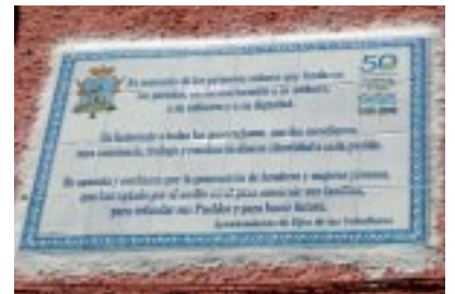
Las actividades que se presentaron en Santa Anastasia recorrieron las temáticas del folclore, el deporte, los testimonios de mujeres y los actos protocolarios de reconocimiento. Todos ellos se desarrollaron con una gran afluencia de público, no solo de Santa Anastasia sino de otros pueblos del municipio y del propio Ejea.

Presentado en Santa Anastasia el día 27 de junio