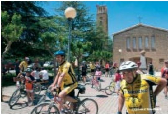
Momento de la salida de la Cicloturista BTT.