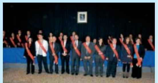
Los alcaldes de los Pueblos y La Llana con el de Ejea.

dio Rural, se van a desarrollar entre 2009 y 2011 en los seis pueblos de colonización de Ejea y que ascienden a millón y medio de euros. De esos fondos, el 80% será aportado por el Ministerio de Medioambiente y el Gobierno de Aragón y 20% restante lo aportará el Ayuntamiento de Ejea de los Caballeros.