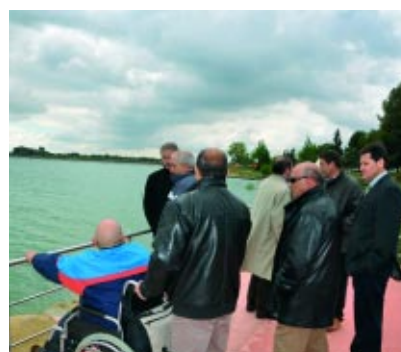
Zona de pesca de San Bartolomé.