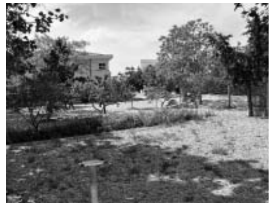
La ampliación del Colegio Público «Ferrer y Racaj» se realizará hacia el espacio que hoy ocupa el huerto y el corral del colegio. En ese espacio se edificará la nueva construcción que se adosará al edificio actual, intercomunicándose con él.

La ampliación del colegio va a consistir en la construcción de un módulo de edificio que se adosará al actual. Tendrá dos plantas, en las que se ubicarán nuevas aulas. La obra será realizada por el Departamento de Educación del Gobierno de Aragón en dos fases. De este modo, el colegio de La Llana aumenta la superficie que dedicará a la impartición de las clases.