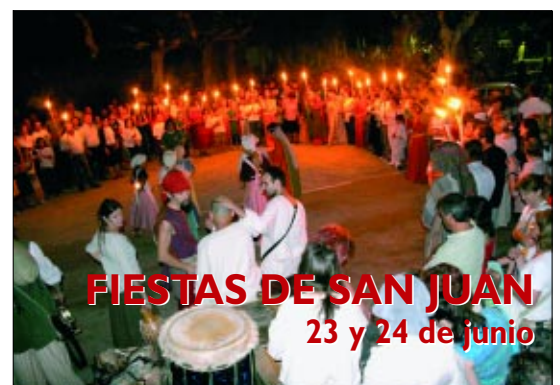
FIESTAS DE SAN JUAN 23 y 24 de junio