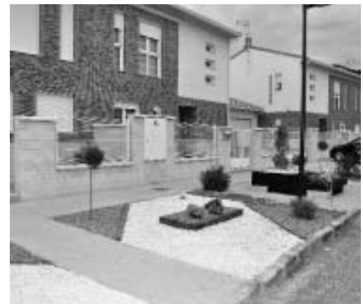
Ajardinamiento de la calle Sol.