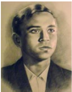
EL POETA Miguel Hernández tendrá dedicada una calle en Ejea.