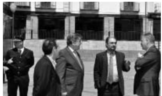
Visita a la Plaza de España.

visualizaron el funcionamiento de los nuevos sistemas de vigilancia que se plantean colocar en lugares como la Plaza España. Después, la comitiva recorrió varias