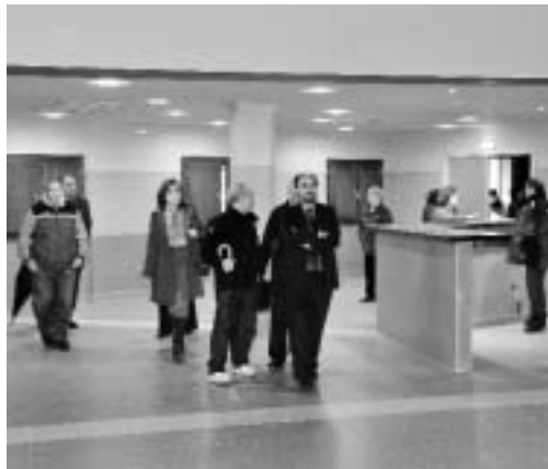
Salón del Baile.