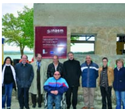
Autoridades, miembros de Club de Pesca y de la Escuela Taller.