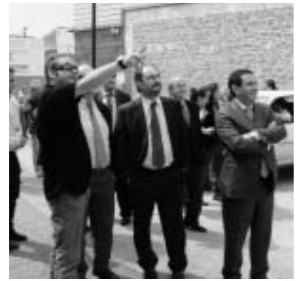
Un vecino explicando la rehabilitación de su vivienda.