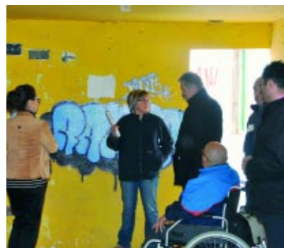
Aspecto actual de Edificio Municipal.