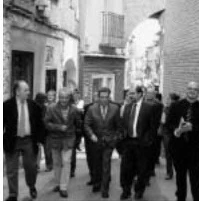
La comitiva en la calle Juliana Larena.