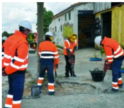
Alumnos de la Escuela Taller.