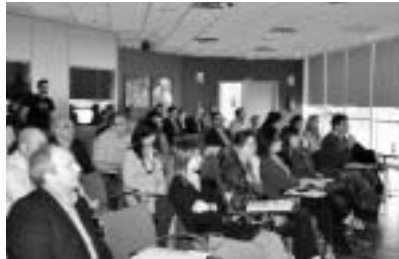
Asistentes a la Jornada.