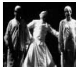
«Habibi/Amado» de Viridiana.

El público infantil forma parte también de nuestros objetivos y el día 27 de mayo habrá teatro para bebés en la Escuela Municipal Infantil. La Compañía Arena en los Bolsillos escenificará