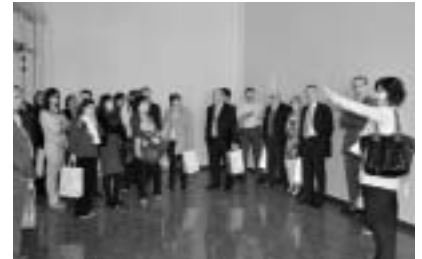
Visita al futuro Centro Tecnológico.