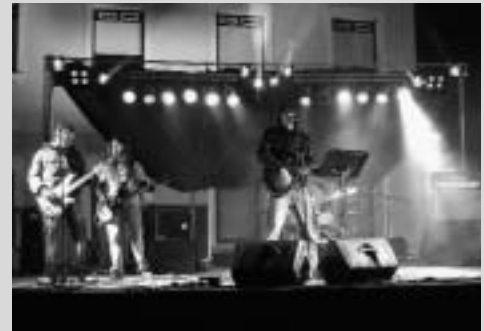
En esta ocasión será el 26 de Junio (Sábado) en la Ciudad del Agua (La Llana), allí podremos disfrutar de la buena música de los grupos locales, que recogen el relevo de las últimas décadas, donde muchos artistas han dejado su huella en mayor o menor medida en el panorama musical de nuestro entorno cercano.