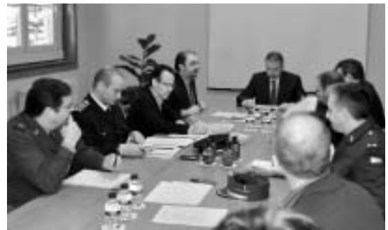
Reunión de la Junta Local de Seguridad en el Ayuntamiento.

Tras la reunión, el Delegado del Gobierno junto al Alcalde de Ejea visitaron las nuevas instalaciones de la Policía Local, donde