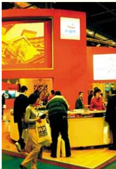
El tiranosaurus rex fue el protagonista del expositor de Aragón.