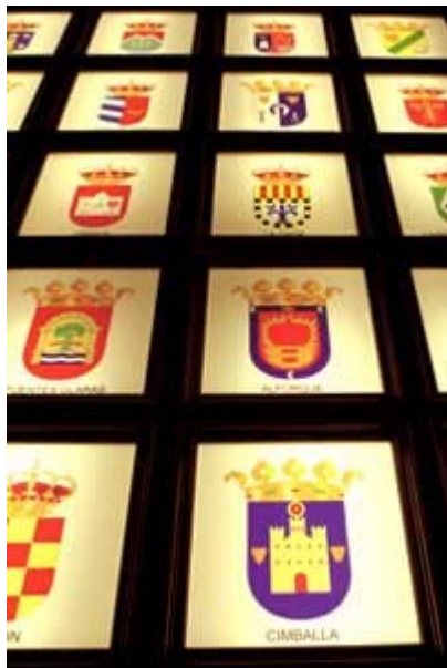
El Museo alberga los escudos de Aragón.

anexión de los distintos territorios fue configurando el actual escudo representativo de esos hitos. Hoy, los símbolos que lo conforman (la encina de Sobrarbe, la cruz de Iñigo Arista, la cruz de San Jorge circundada por las cuatro cabezas de moros, las barras de Aragón...) resultan familiares y son plenamente reconocidos por los aragoneses.