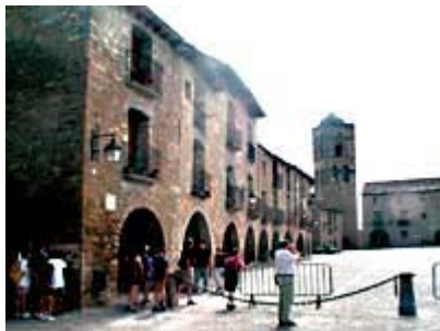
La Comarca de Sobrarbe conservará el patrimonio cultural de municipios como Aínsa.