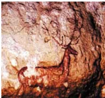
La comarca realiza un gran esfuerzo en promocionar las pinturas rupestres del Parque Cultural Río Vero, declaradas Patrimonio de la Humanidad en 1998 por la UNESCO