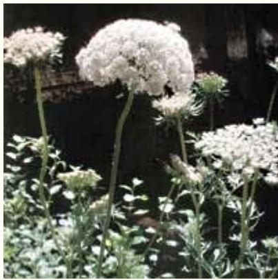
“Zanahorias” de Carlos Zaragoza fue la ganadora del concurso.