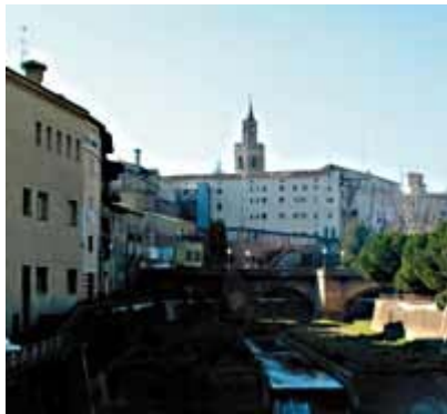
El río Vero a su paso por la ciudad de Barbastro, futura capital de la comarca.