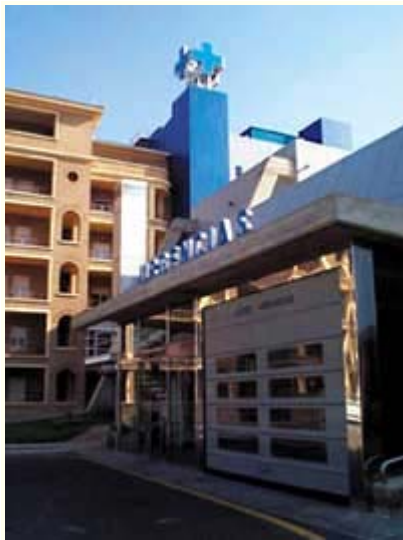
Acceso al Servicio de Urgencias del Hospital Royo Villanueva.

sanitario de la Comunidad Autónoma con sus usuarios. Aragón, de esta manera, se ha colocado como pionera desde el inicio del proceso de transferencia de las competencias sanitarias a las Comunidades autónomas en adoptar el concepto "salud" como marca. Por un lado, ese concepto se corresponde con las iniciales del organismo responsable de la prestación de los servicios sanitarios de Aragón, ahora asumidos desde el Ejecutivo autónomo. Por otro, simboliza el objetivo final de este servicio de salud en el que se antepone el posesivo "nuestra" como mensaje de proximidad, identidad y pertenencia a los aragoneses, así como la voluntad del Departamento de Salud, Consumo y Servicios Sociales del Gobierno de Aragón de asumir como compromiso el desarrollo de un servicio propio, dinámico y de calidad. La Comunidad de Aragón, con un territorio que supera los 47.000 kilómetros cuadrados, y una población cercana a 1.200.000 habitantes, tiene un gasto sanitario per cápita de 991,67 euros (165.000 pesetas). Según los datos de SALUD, actualmente se dispone de 1,7 médicos por cada mil habitantes, con un presupuesto sanitario para 2002 superior a los 1.105 millones de euros (184.000 millones de pesetas). Por otra parte, y dentro de la estadística de centros de salud por cada mil habitantes, la cobertura por medio del nuevo sistema de atención primaria es del 99%, con un total de 116 centros de salud y 874 consultorios locales. Aragón cuenta con un total de 5.524 camas hospitalarias.