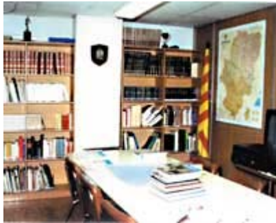
Muchos de los centros poseen un rico patrimonio artístico y cultural, como la biblioteca de la Casa de Aragón en Sabadell.

eficaces de apoyo que le ayudan a potenciar su labor. A través de esta norma, las competencias en materias de casas y centros aragoneses las gestiona el departamento de Presidencia y Relaciones Institucionales del Gobierno de Aragón, mediante el Servicio de Comunidades Aragonesas del Exterior.