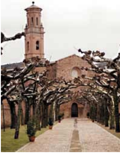
El Monasterio de Veruela (S. XII al XV) es una de las joyas de la arquitectura religiosa de la comarca y de Aragón.