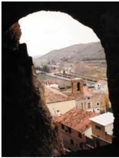
Panorámica de Los Fayos, contemplados desde la Cueva del Caco.

que, en conjunto, abarcan algo más de 450 kilómetros cuadrados. Por un lado, en las estribaciones del Moncayo se esconden pequeños núcleos rurales que viven de la agricultura, la ganadería y, cada vez en mayor medida, del turismo. Por otro, en la llanura que se extiende más al norte, ya en contacto con la Ribera de Navarra, los pueblos son más grandes y se dedican preferentemente a la actividad industrial. En esta parte, la explotación de la tierra es a menudo una dedicación a tiempo parcial que se compagina con el empleo en el sector secundario y en los servicios.