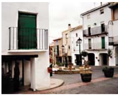
El municipio de Torrellas cuida especialmente su casco urbano. Recientemente ha rehabilitado los soportales de la Plaza Mayor.

Además, desde que en 1997 se terminó la construcción de la presa de Val en su único afluente, el Queiles se ha convertido en una importante garantía de desarrollo para las localidades ribereñas. "El embalse de Val -augura Javier Calavia- servirá para potenciar los regadíos, la industria y el sector turístico de la comarca". Las aguas del Moncayo ampliarán la capacidad de los tradicionales sistemas de riego de localidades como Novallas, Malón, Vierlas, Cunchillos y la misma Tarazona. Pero, para sacar el máximo rendimiento a las reservas del embalse, "será preciso acondicionar y ampliar la red de canales y acequias y proceder a una concentración