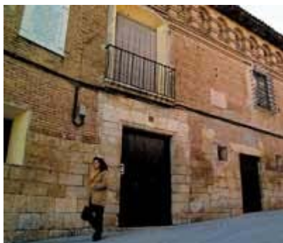
Casa de Pedro Cerbuna en Fonz.

Cinca Medio ha iniciado con buen pie el programa comarcizador. A través de la mancomunidad del mismo nombre, la entidad ha acumulado una importante experiencia en la gestión supramunicipal, aunque la Ley de Comarcalización les ha permitido ir más lejos de lo que esperaban. Antes de su llegada, los nueve municipios se habían embarcado en proyectos conjuntos, algunos de los cuales ya se pudieron culminar gracias a los convenios de los años 2000 y 2001, enmarcados dentro del Plan de Política Territorial y suscritos por el Gobierno de Aragón, la Diputación Provincial de Huesca, la mancomunidad y los nueve ayuntamientos.