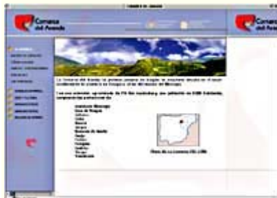
La página web de la Comarca del Aranda presenta un diseño muy sencillo.

El sistema ha sido desarrollado por la Dirección General de Ordenación Administrativa y Servicios en colaboración con el Instituto Aragonés de la Mujer y está incorporado en la Red Aragonesa de Comunicaciones Institucionales (RACI).