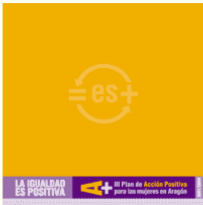
Portada del III Plan de Acción Positiva.

El conjunto de las once áreas de este III Plan de Acción Positiva