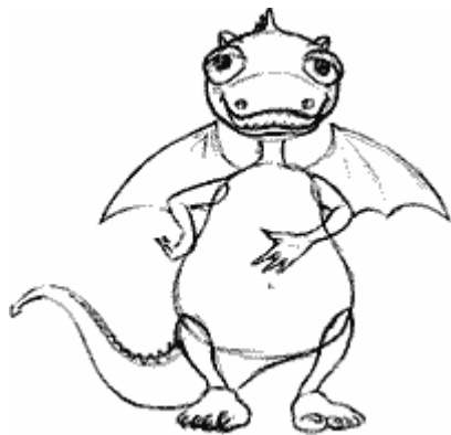
Bocetos de "Argui", la mascota del CD de heráldica de Aragón.