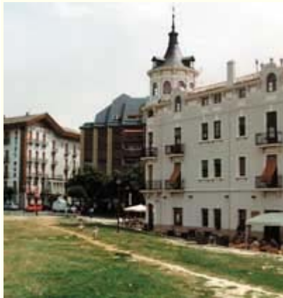
El proyecto de Ley afectará a municipios como Jaca.

Posteriormente la Comisión Provincial de Patrimonio dará el visto bueno, y tras la licitación de las obras se procederá a la adjudicación con la previsión de comenzar las obras antes de verano.