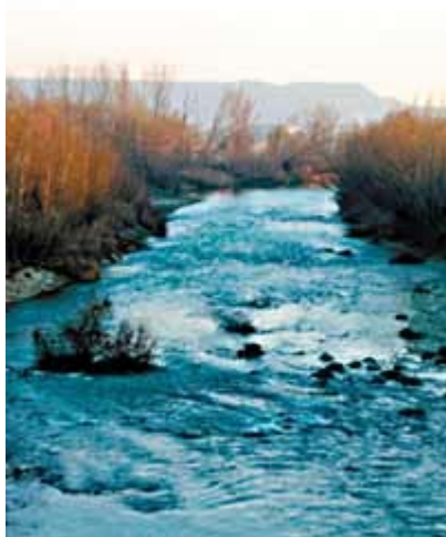
El río Cinca da nombre a la comarca