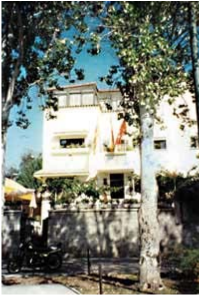
Madrid posee dos centros de Aragón. Uno de ellos en la céntrica plaza de República Argentina.