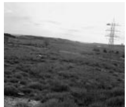
Las actuaciones de la primera fase de la Ciudad del agua llevan un ritmo adecuado. En las imágenes superiores se ilustran algunos aspectos del desarrollo de este proyecto: obras en el Parque Lineal del Gancho, obras del edificio de Aquagraria, recreación virtual de su imagen exterior y zona de interconexión natural.