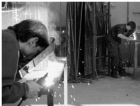
Alumnos de la Escuela Taller.

En materia de programas de solidaridad, además del Servicio Social de Base, se mantienen las ayudas de urgencia o las actividades con la población inmigrante y se incrementa sustancialmente la aportación a convenios, entre los que se incluye el de la Cruz Roja, cuyo objeto es el transporte de personas mayores de los pueblos. Habrá asimismo un nuevo Plan de Accesibilidad para Personas Discapacitadas, con inversiones tales como la adaptación de piscinas para discapacitados o una parti-