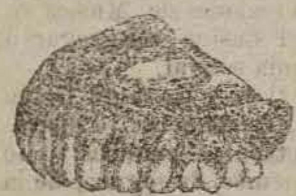
Cirujano Dentista de la Facultad de Medicina de Madrid

Orificaciones, empastes y extracciones sin dolor con instrumentos modernos. Colocación de dientes y dentaduras por todos los sistemas.