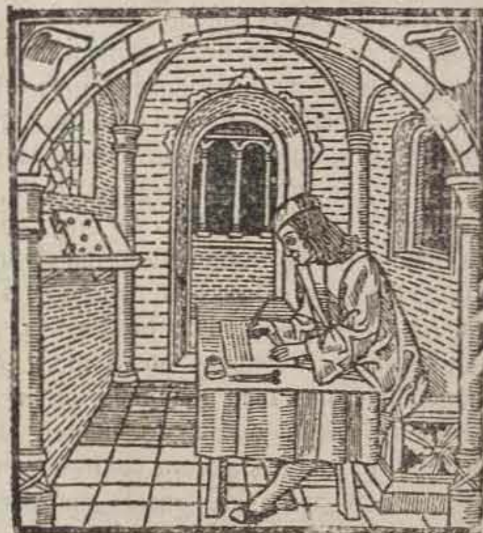
UN CRONISTA DE LA EDAD MEDIA

memorias antiguas que la toma de Salvatierra fué después de aquella primera entrada». (1) (2)