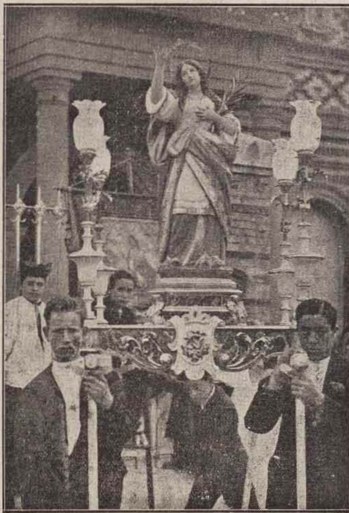
SANTA OROSIA, PATRONA DE JACA