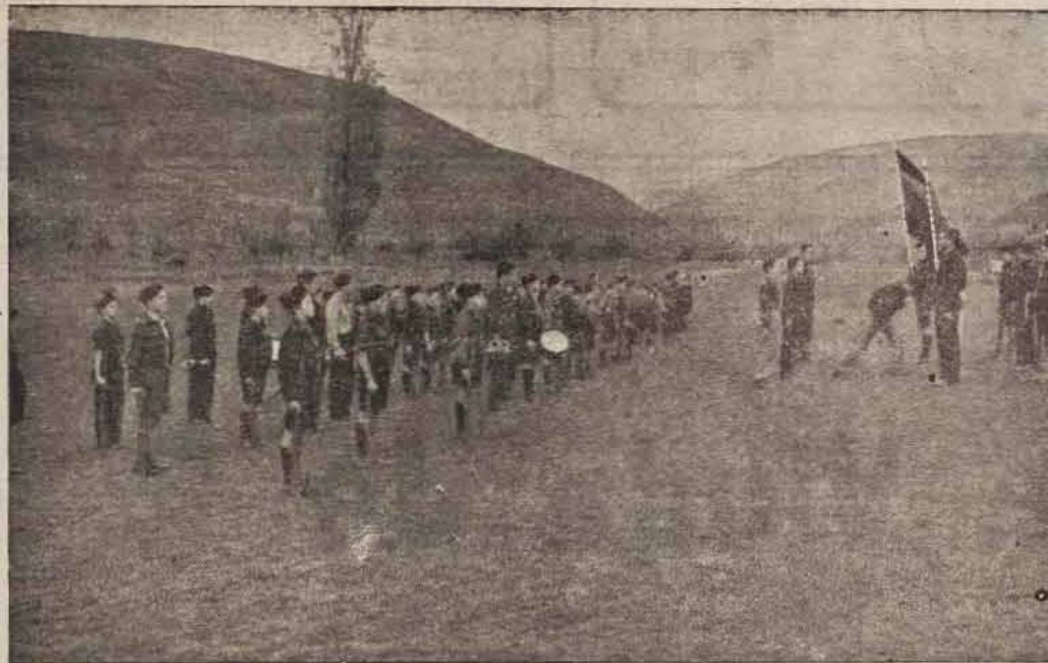
Nuevos Jefes, prestando juramento a las banderas, ante la tropa que se les confía.

Más no pensaron con su dinero (no es caso) remediar el vacío que dejaba su portentoso talento, lince en observar quebrantamientos de leyes y topo para no querer ver las miserias y anhelos de los chicos, de quienes será pronto España. Por parte de éstos, si había culpa, ya sufren la condena por obra de los celadores del código, ya que se les ha privado de un-