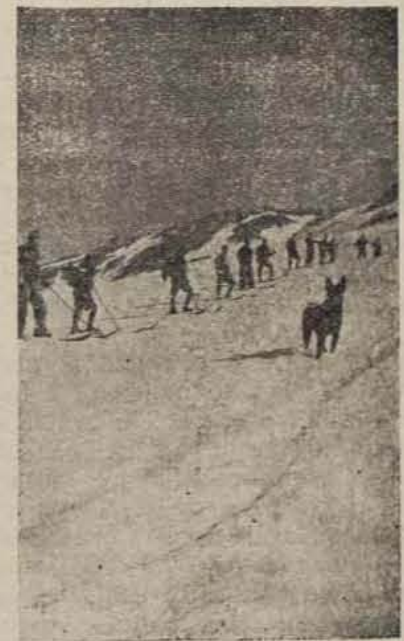
Una escuadra en las laderas del imponente Tobazo, dispuesta a salir. La mascota «el flecha» en primer término.

El secretario es un cadete bachiller próximo a pasar a 1.ª Línea. Existen además los siguientes cargos desempeñados por cadetes especializados en los respectivos servicios: Jefe y Subjefe de Servicios, que atienden a la organización y ordenamiento de los servicios periódicos y accidentales que los afiliados deben prestar en la Organización o en relación con ella. Ayudante y Subayudante, que dirigen los trabajos de oficina y reciben encargos y peticiones de servicios, preparan el trabajo al Delegado y le imponen en la marcha del día, y coordinan las atribuciones de los demás