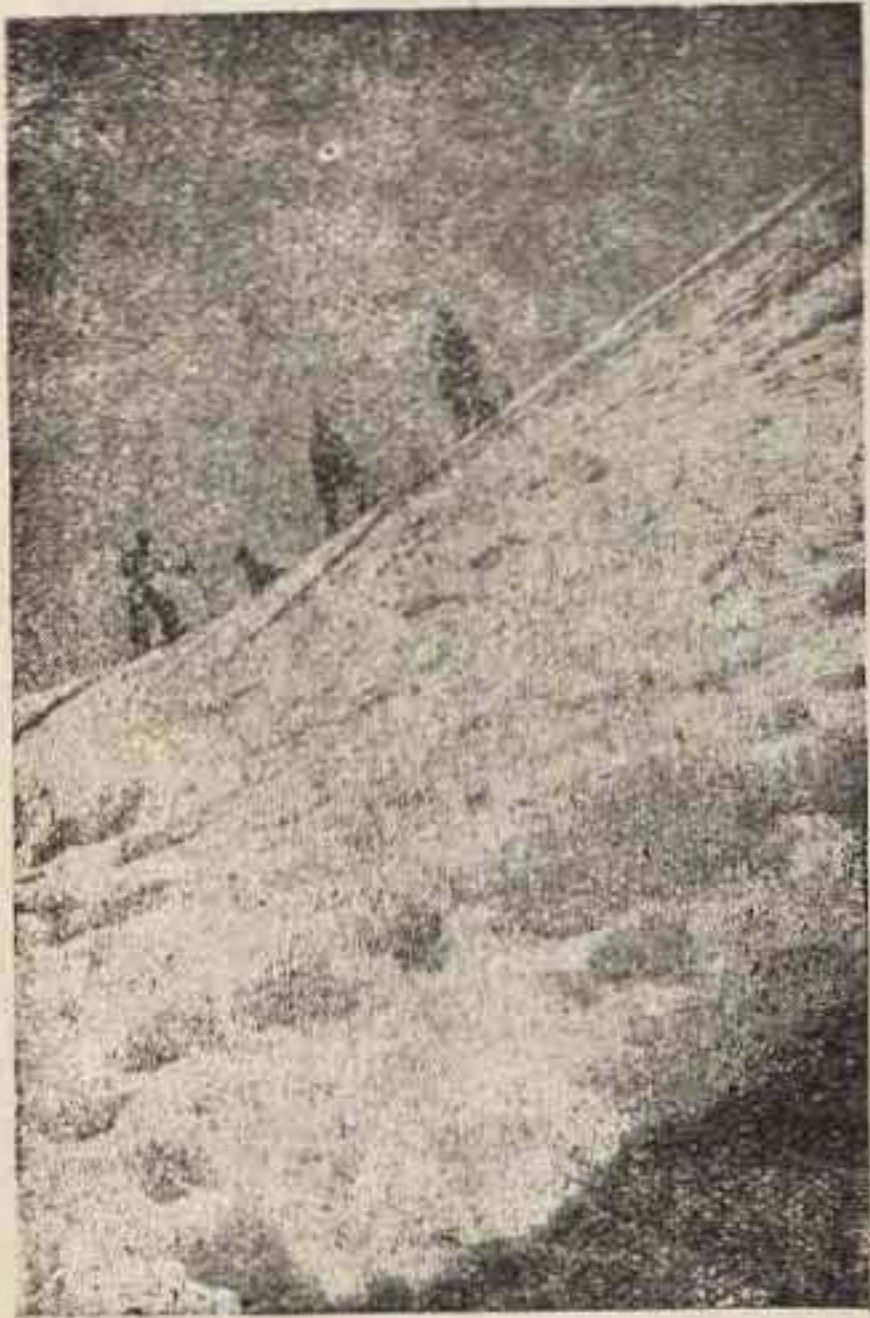
Una patrulla de reconocimiento, desafiando el peligro, y tendiendo su mirada a la ingrata Francia.

Punto aparte merecen las prácticas de campamento que desde abril se venían haciendo con miras al que luego había de ser campamento de Flechas de San Juan de la Peña, primero en su estilo en la Es-