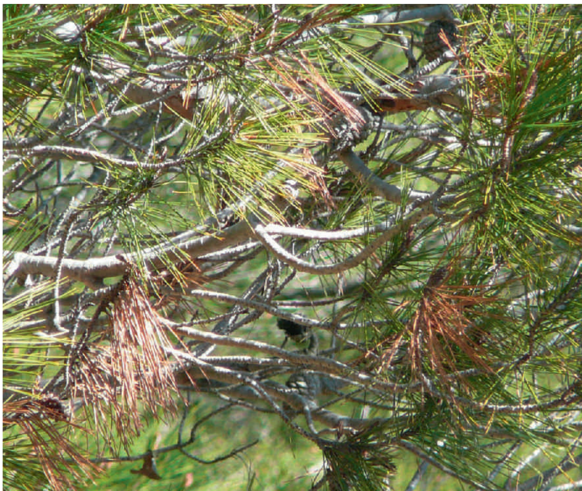
Fig. 1. Disposición en "bandera" provocada por Sirococcus conigenus .

Sirococcus conigenus (DC.) P. F. Cannon & Minter FUNGI. ASCOMYCOTA. Incertae sedis .