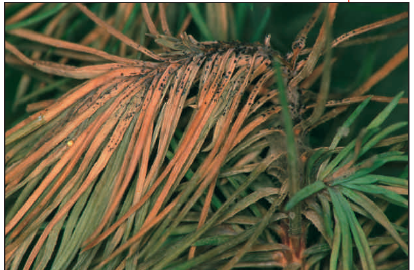
Fig. 6 (Autor: Miguel Cambra Álvarez)