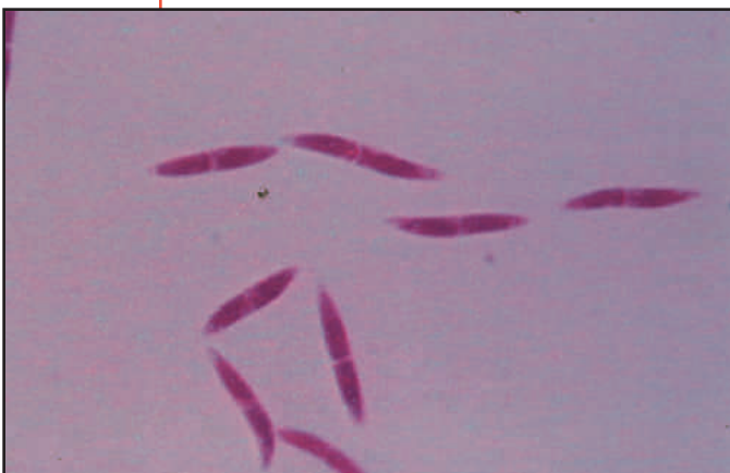
Fig. 7 (Autor: Miguel Cambra Álvarez)

Fig. 3. Aspecto de una masa forestal de Pinus halepensis infectada por soflamado.