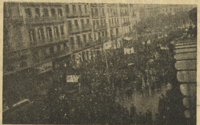
La comitiva desfila por la Ronda de S. Pedro