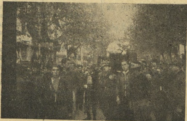
El féretro conducido por sus compañeros