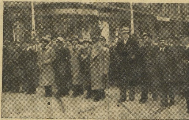
El duelo presidido por Companys