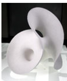
Stoneware Sculpture. Eva Hild