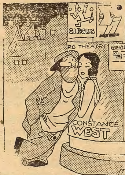
La del cartel.—Este manguán ha confundido las letras. Se arrima pensando en la Z.