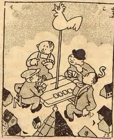
—No sé por qué subírnos a la valeta para echar la partida. —En cualquier otro sitio sería peligroso. Ya ni en Tabernas se puede jugar.

Se reciben donativos en la Redacción de EL PUEBLO, Palma, 9.