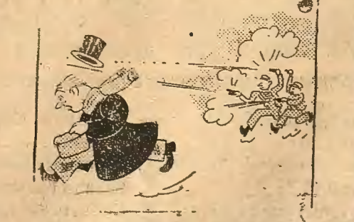
—Le da la reacción ya lo sabía; pero no creía que tanta. Y lo de derechas lo dirán porque vienen como balas.