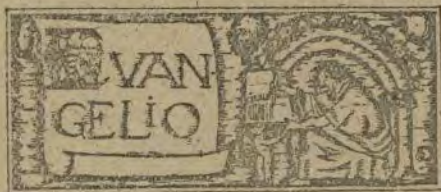
Domingo dentro de la Octava de la Epifanía. (S. Lucas II, 42-52).

Que queramos ser verdaderos soldados de Cristo en las filas de la Acción Católica, y El nos dará fuerzas para poder hacer bella realidad nuestra misión de «llevar almas de joven a Cristo...»