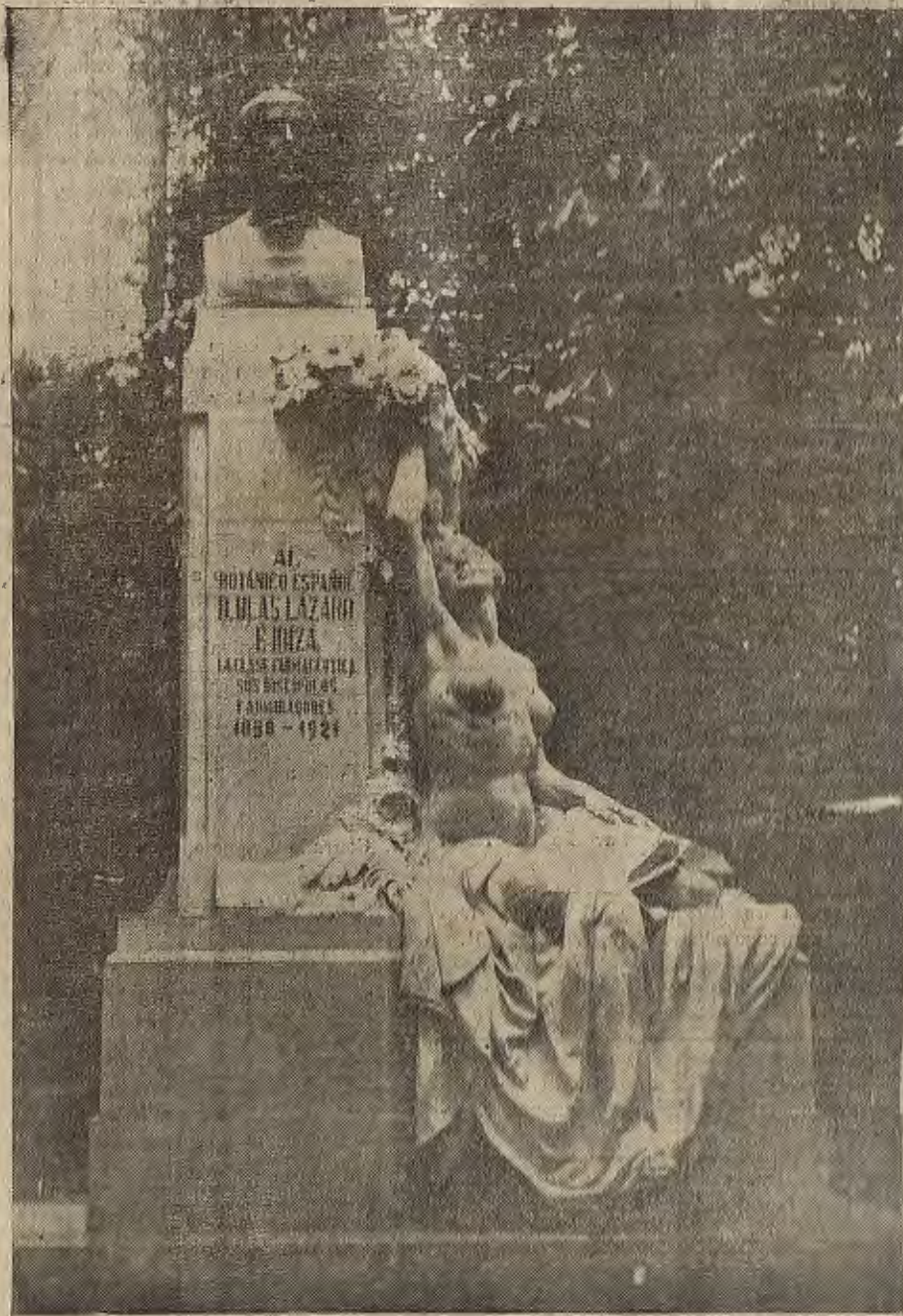
MADRID.—Monumento, que acaba de ser inaugurado, para perpetuar la memoria del sabio botánico español D. Blas Lázaro e Ibiza

Suscríbese a LA VOZ DE ARAGÓN en sus oficinas, San Miguel, 3, Zaragoza. No deje de leer ni un solo día LA VOZ DE ARAGÓN. A diario encontrará en ella información amplísima de los acontecimientos de todo el mundo y artículos de colaboración autorizados por las más reputadas firmas.