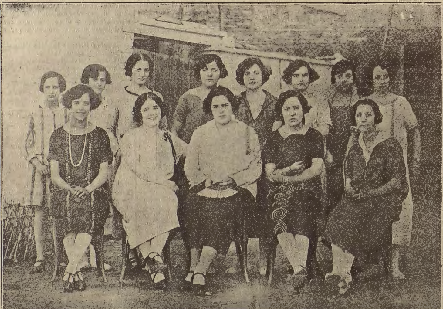
ALAGON.—Señoritas que postularán en la Fiesta de la Flor que se celebrará mañana domingo.

en el Norte o en la montaña. Se encargarán a la Inmobiliaria. ALFONSO I, 16, entr. (de 11 a 1)