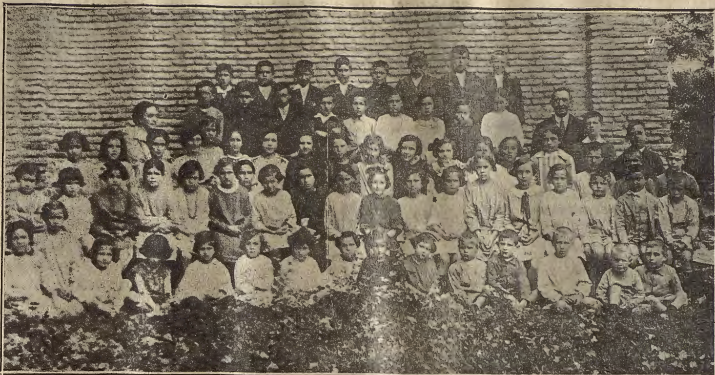
GARRAPINILLOS.—Los niños y las niñas que asisten a las Escuelas nacionales, con sus profesores después de la visita realizada a las respectivas exposiciones escolares.

Y para final vayan estas copias que no tienen otro mérito que el de la espontaneidad.