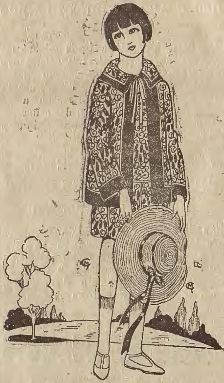
Núm. 2.—También hacen furor las telas estampadas para las niñas; este modelito, compuesto de vestido y chaquetón, se adorna con tiras de uno de los tonos del estampado.

cación de forma; son flexibles y el linón ha reemplazado ventajosamente a los alambres y esparteros que le daban rigidez e incomodidad. Los destinados a playa y campo se hacen de cretona estampada o paja rústica, alegres con unas cintas, unas flores, frutas sólidas de lana, o cualquier detalle que recuerde al vestido.