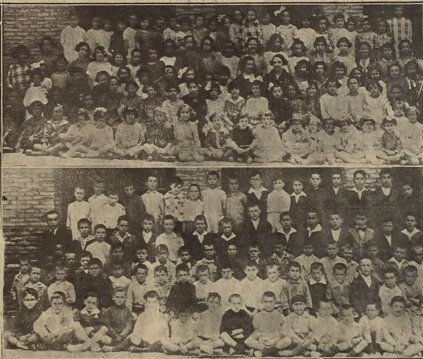
Niñas y niños de la escuela de Montemolín en el acto de la visita a la exposición escolar.

Cuarenta Horas.—En la iglesia de San José de Calasanz (Madres Escolapias).