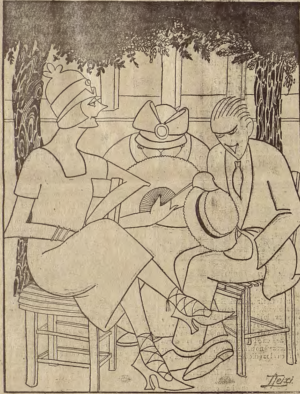
DEBE RESPETARSE LA PRESCRIPCIÓN FACULTATIVA.—Como los aires de mar nos perjudican, este año pasaremos el veraneo en Bujaraloz!

Desde luego en Zaragoza podrán prescindir hasta de la más pequeña octavilla anunciadora, porque, a juzgar por la expectación de ayer, va a haber luchas homéricas y kilométricas colas para adquirir localidades.