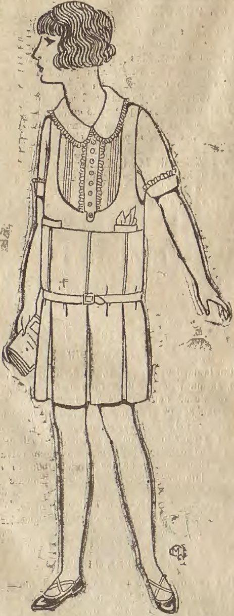
Núm. 1.—Este traje está inspirado en el uniforme de colegio de las niñas inglesas. Puede confeccionarse en «Kasha» de bonito color y le acompaña una blusa de seda blanca o color crudo.

números una página especial de vestidos para niños; cronista hay que dice que «los niños son el más favorecedor adorno de la mamá», (que ellos perdonen el que se les ponga a la altura de una fantasía cualquiera de la moda) y algunas casas creadoras, como si repentinamente se hubiesen dado cuenta de la existencia de los niños en nuestro planeta, se han dignado abrir un departamento especial para la moda infantil.