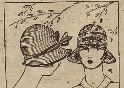
Núm. 4.—Sombrerito de crin rojo adornado con un lazo de cinta doble negra y roja. El otro modelito es de cretona estampado en bonitos colores adornado con cinta y barbaquejo.