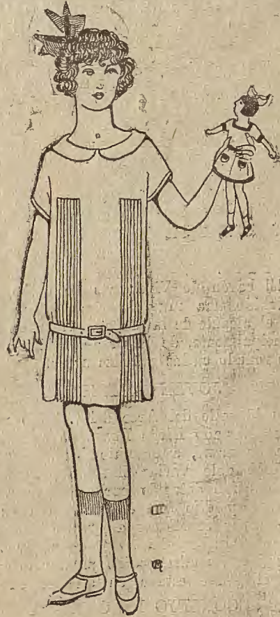
Núm. 3.—Como la sencillez es la nota característica de la moda; especialmente en las niñas, este modelito es de crepón de China azul lino, con dos grupos de plisados delante y detrás; cuello y cinturón blancos; nada más, porque eso le basta para estar «chic».

Hace veinte años, aquellos jóvenes no hubieran acabado bien su bronca. Probable-