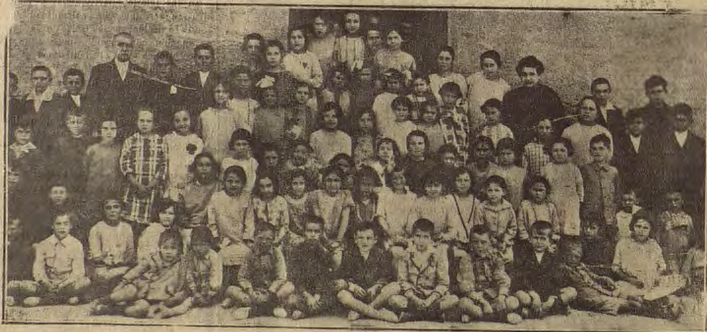
VISITA OFICIAL A LAS EXPOSICIONES ESCOLARES.—Niños y niñas de la escuela de la Cartuja.