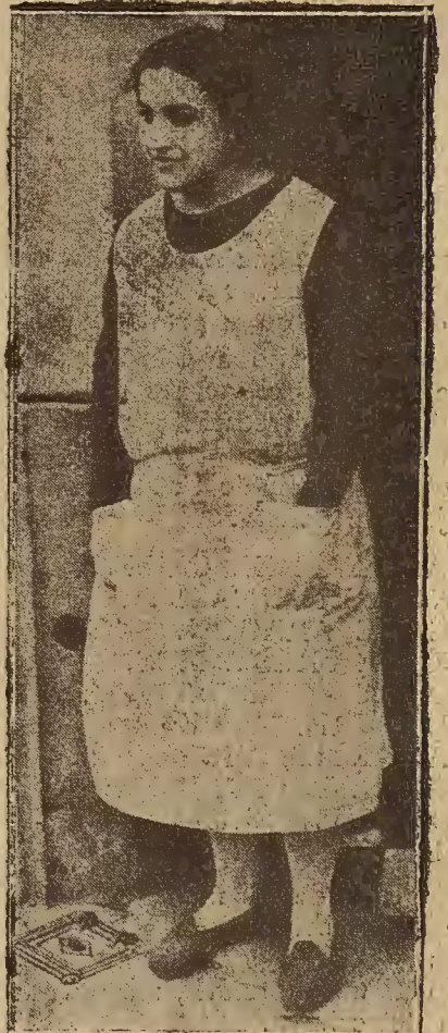
UN CRIMEN MISTERIOSO EN BARCELONA

He aquí una de las misteriosas sectas que la inmensa colmena que es Nueva York, mantiene en su seno.