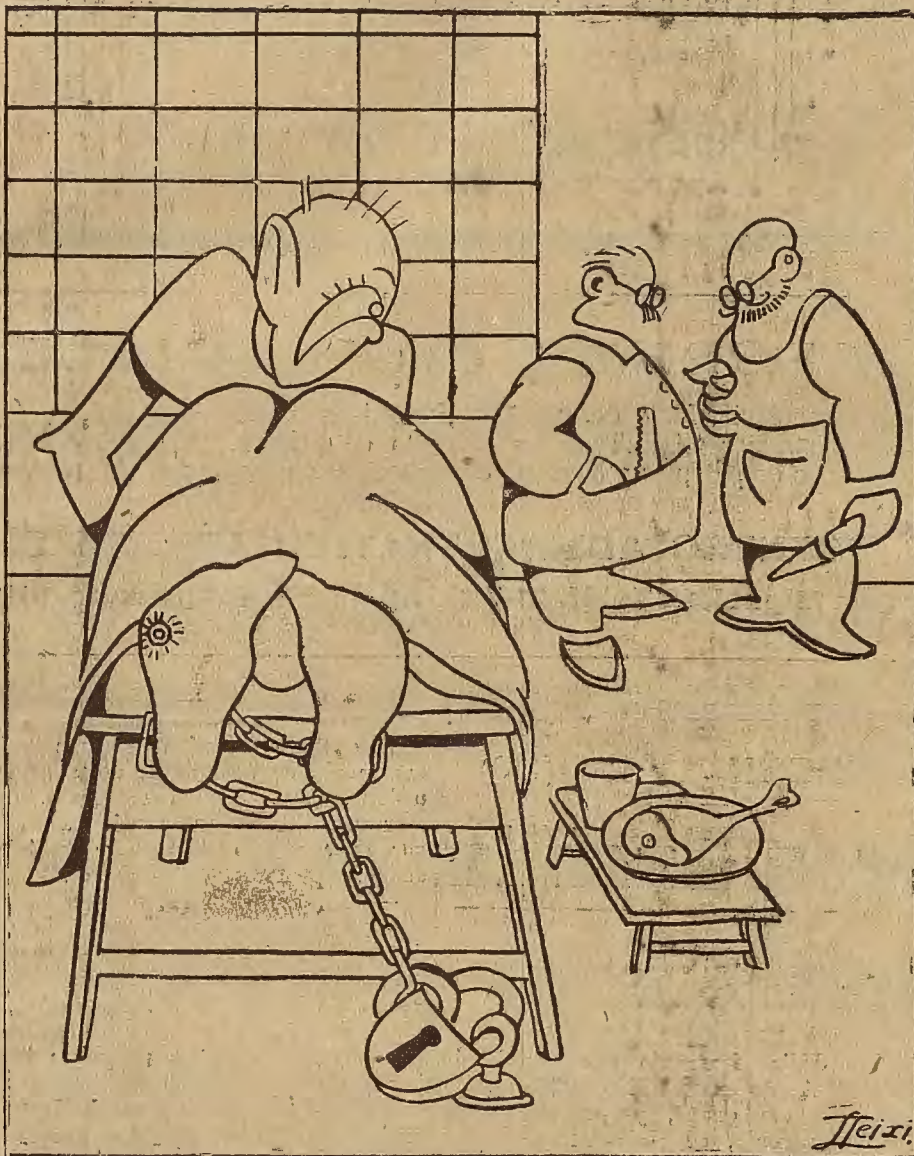
ANTE TAL DECISION, NO VEO OTRO REMEDIO