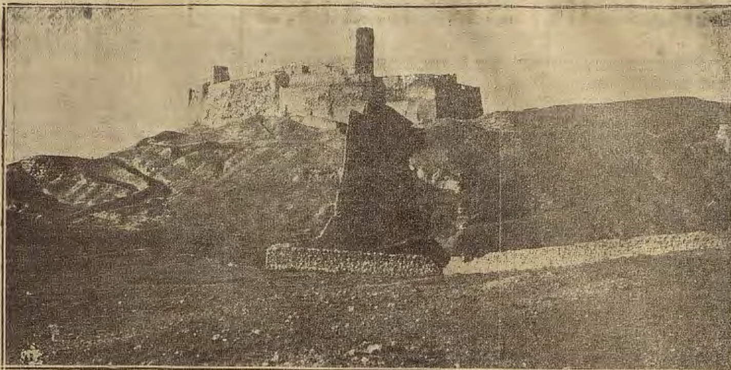
ARAGON PINTORESCO.—EL CASTILLO DE AYUD, EN CALATAYUD

gimnasia, demostrando ante competentes tribunales ciertos conocimientos gimnásticos y educativos, obtendrán otros 45 días.