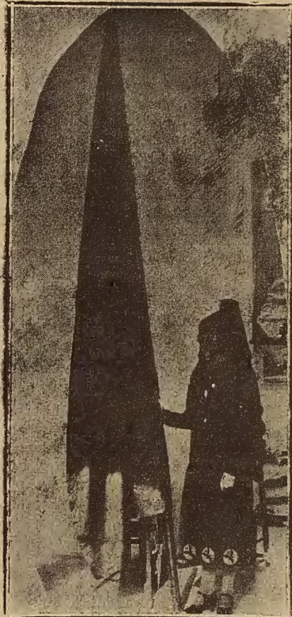
SEÑORITA ORIA PELEGRIN

Quedaron todos los comensales satisfechos, tanto del menú como del servicio.