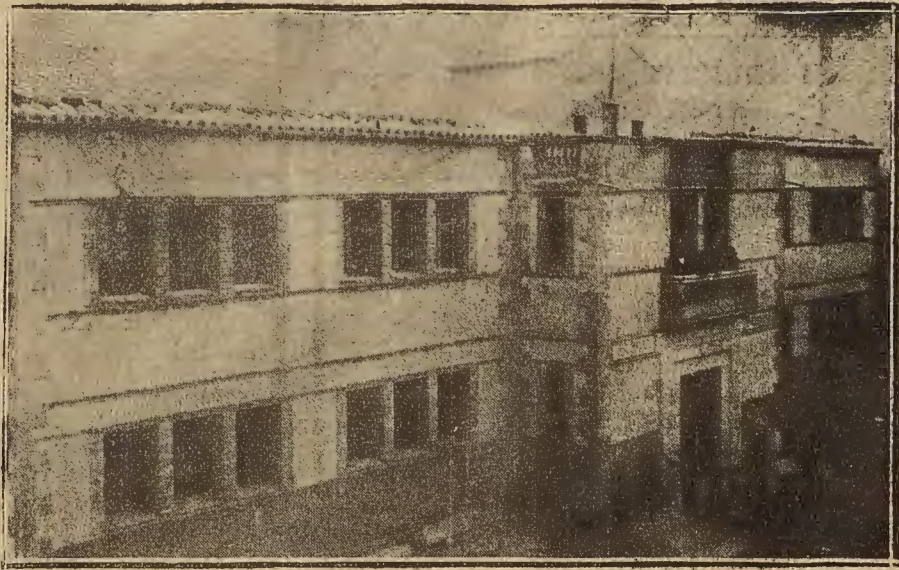
ESCUELAS NACIONALES DE MAZALEON, QUE FUERON INAUGURADAS EL DIA 22 DEL ACTUAL