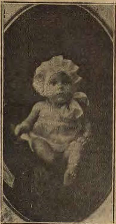
Felicidad E spl Fardos