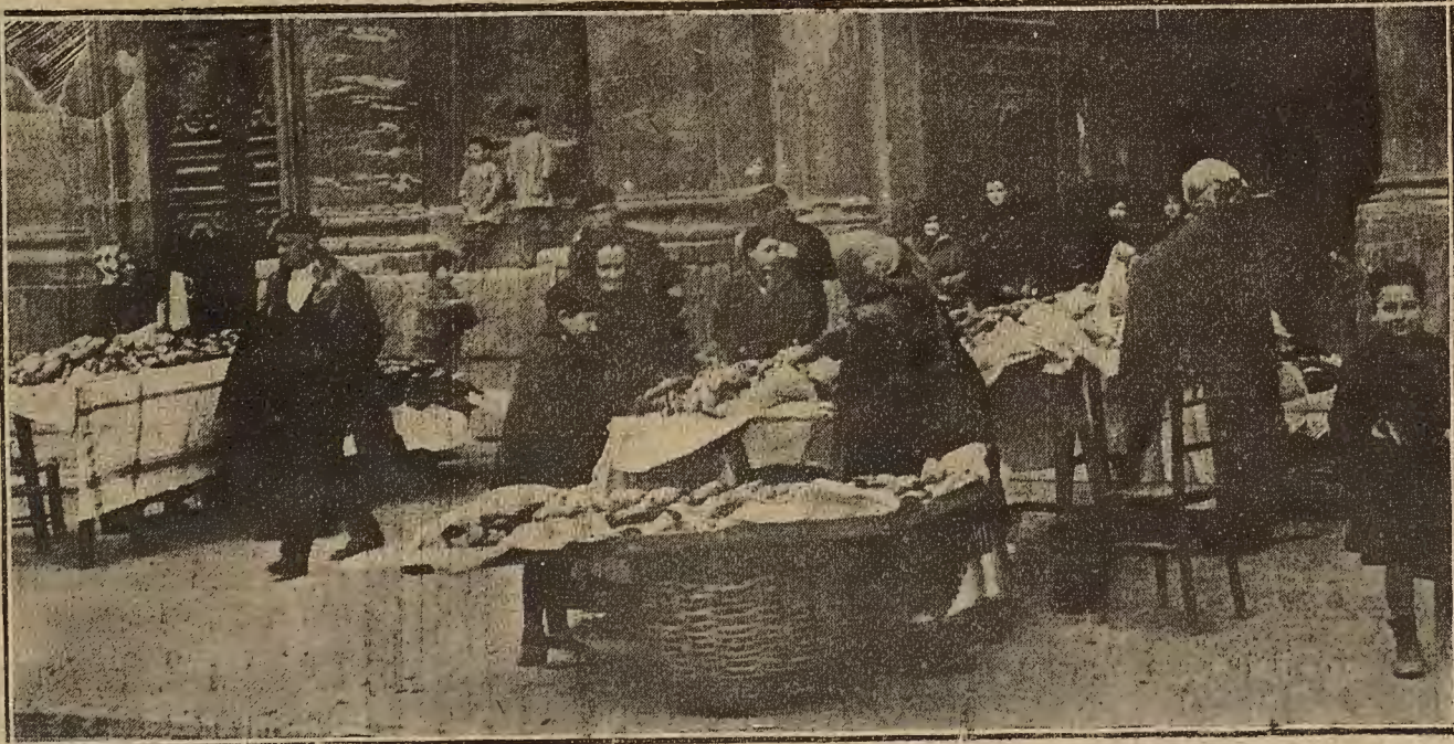
NOTA CALLEJERA LOCAL: EL DIA D.E. SAN VADERO.—LA VENTA DE ROSCONES EN LA PLAZA DE LA SEO.