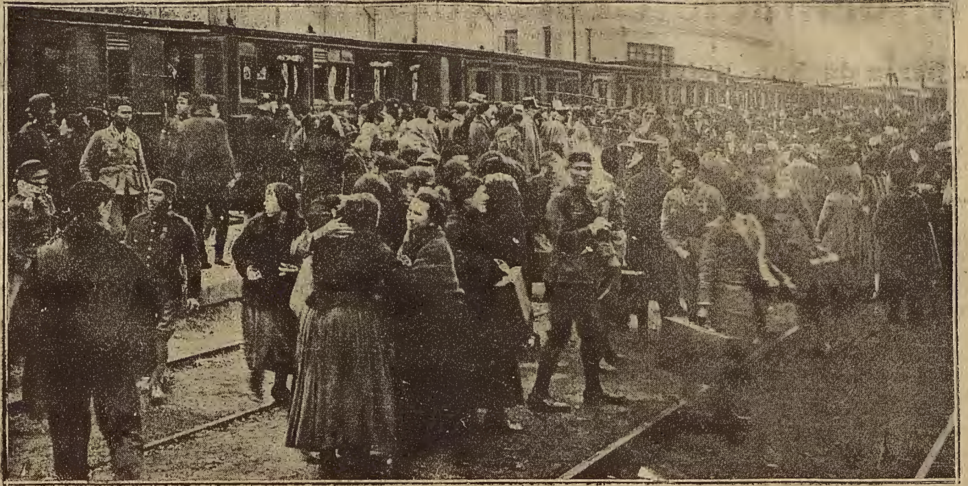
LOS LICENCIADOS LLEGAN.—MOMENTO DE LLEGAR EL TREN ESPECIAL QUE CONDUJO A ZARAGOZA A LOS SOLDADOS QUE PERTENECIERON A LOS CUERPOS DE GUARNICION EN AFRICA Y QUE REGRESAN LICENCIADOS A SUS HOGARES

Hubo en los dos tiempos un marcado dominio del Iberia, que se reflejó, naturalmente, en el resultado apuntado.