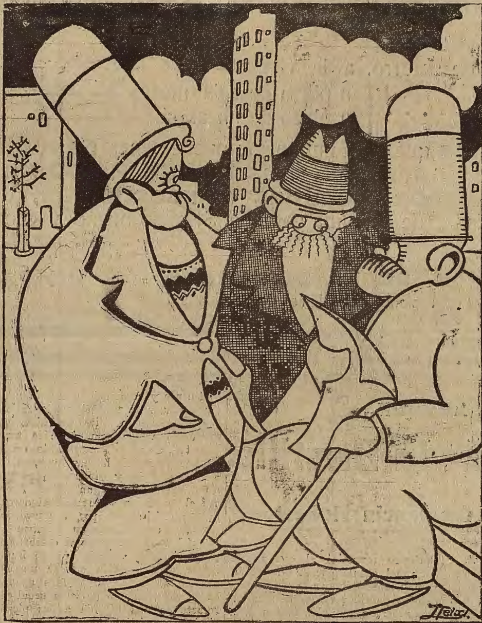
—¿Qué les importa a más de cuatro que desaparezca el descanso dominical, mientras ellos lo puedan hacer permanente!

Con solo acelerar el movimiento de la música sirvió para muy distintos rigodones.