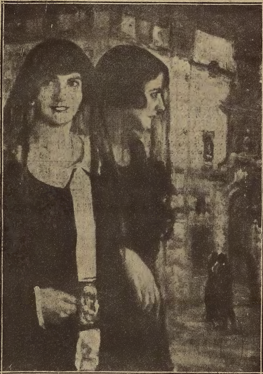
«Tempraneras», cuadro de Vicente Cobreros Uranga, que figura en la exposición abierta en el Centro Mercantil