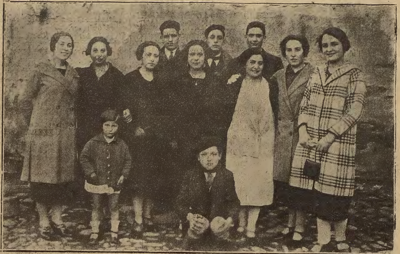
ATECA.—De los varios grupos de chicas guapas de la localidad, es éste uno de los que más se han distinguido por su movilidad y alegría en los bailes celebrados durante las fiestas de San Blas