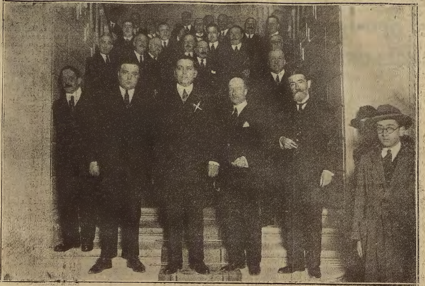
MADRID.—El ministro de Hacienda señor Calvo Sotelo (x) con sus compañeros los de Trabajo e Instrucción Pública y varios concurrentes a la conferencia dada por el primero en la Academia de Jurisprudencia para explicar el alcance de los reales decretos sobre régimen tributario

Holados, Bocadillos, Licoros, Chocolates, Repostería, Mariscos