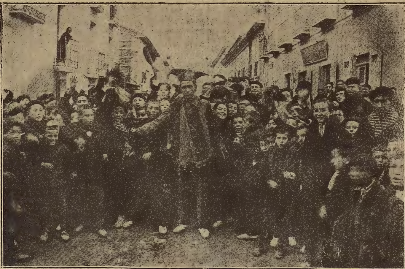
LAS FIESTAS DE SAN BLAS EN ATECA.—La tradicional fiesta de la máscara, o el terror de los chiquillos