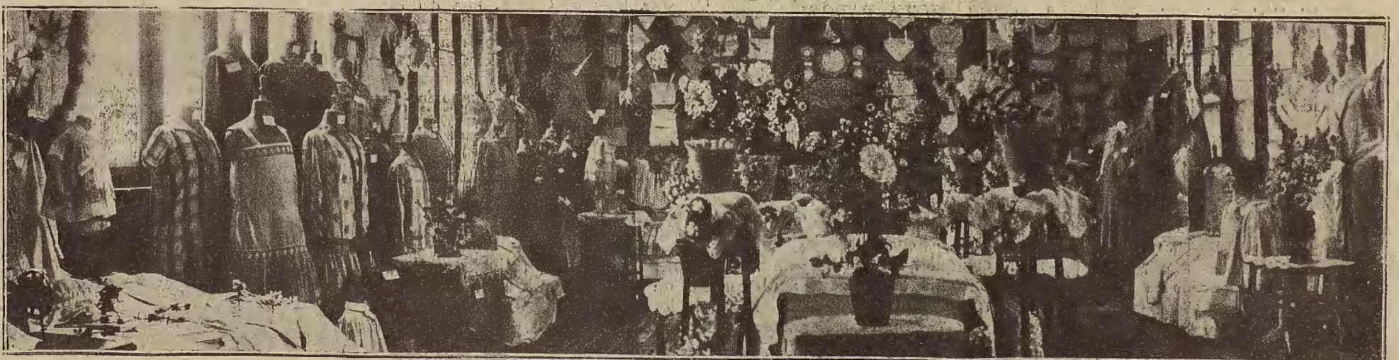
LAS EXPOSICIONES ESCOLARES EN ZARAGOZA.—Aspecto del local de las escuelas de aprendizas, sostenidas por el Ayuntamiento. (Foto A. de la Barrera).