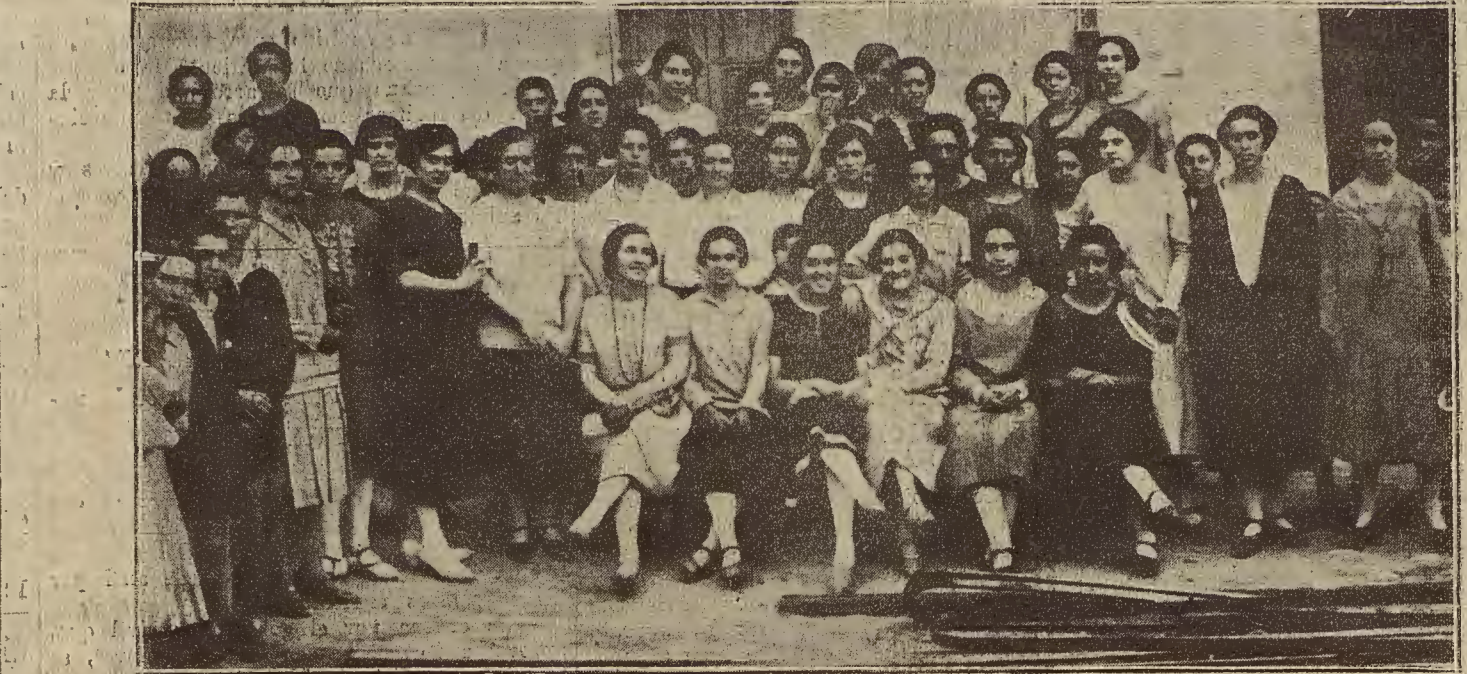
DE LAS FIESTAS DEL BARRIO DE SANTA ISABEL.—Señoritas que con su presencia dieron a los festejos la nota más agradable.

hierro, reciben el agua de una bomba que la aspira y comprime a la presión indicada. La bomba es accionada por un motor de 20 caballos.