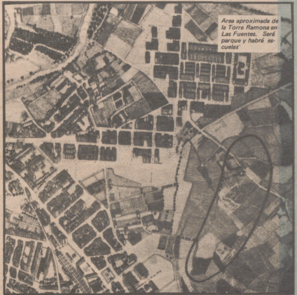
Area aproximada de la Torre Ramona en Las Fuentes. Será parque y habrá escuelas.

La Torre Ramona no va a solucionar plenamente los problemas de Las Fuentes, pero hará posible la creación de un alto