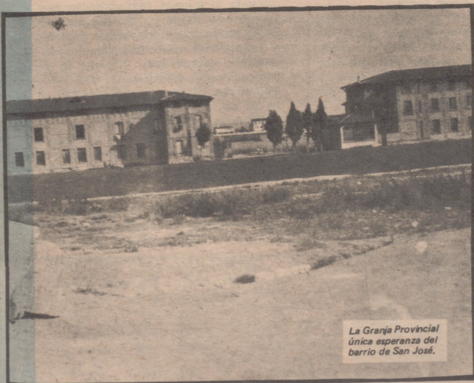
La Granja Provincial única esperanza del barrio de San José.

Los padres de los alumnos del «Calixto Ariño» quisieran impulsar las cosas para que en el próximo mes de septiembre el nuevo colegio pueda estar en marcha. Parece que no será posible, pero al menos el Ayuntamiento piensa dar toda la urgencia para que empiece la construcción. Mientras, el resto de la enorme finca provincial de la Granja sigue siendo, para los vecinos de San José, una especie de «tierra prometida» que les permita —como alguna vez ha ocurrido con Torre Ramona en Las Fuentes— contar con un parque. El más cercano está a varios kilómetros.