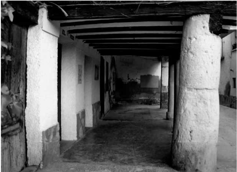
El Pilá, en la calle Mayor.

zabucá echar, tirar; zabucá-se echarse, tirarse