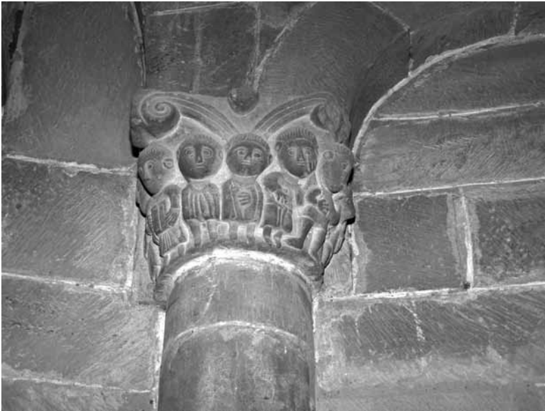
Capitel en la ermita de San Román de Castro.

capá capar, castrar capadó capador, castrador capallá hacia allá capaquí hacia aquí capau, da castrado, capado capazeta capacho, capazo pequeño; anteojera caperucha caperuza capilleta hornacina capolá descabalar; descuartizar; machacar capotaz capataz capuzá capuzar, zambullir; capuzá-se capuzarse, zambullirse