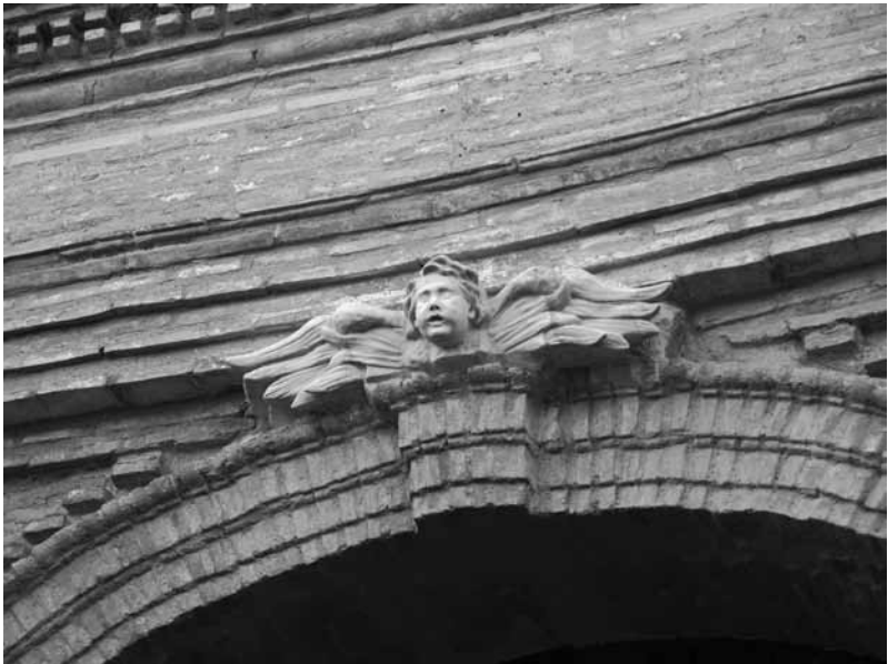
Detalle del exterior de la iglesia parroquial.