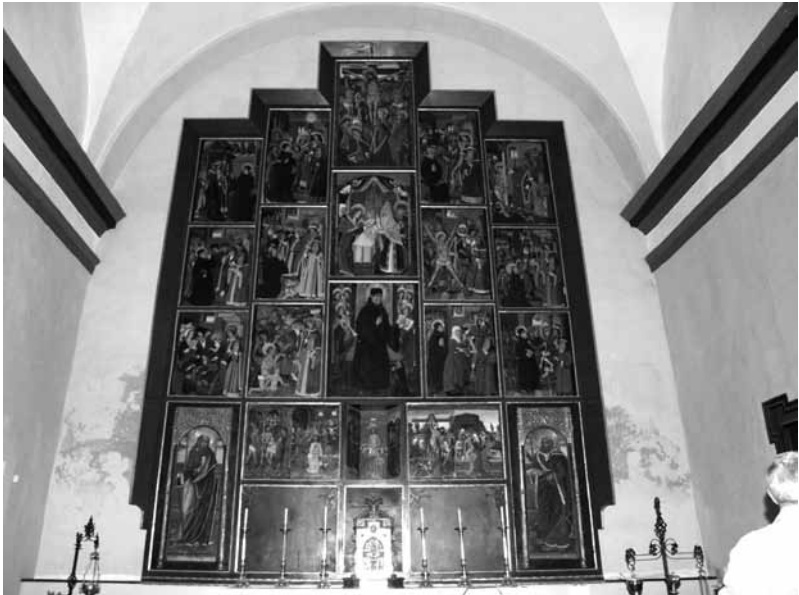
Retablo de la iglesia parroquial de Santa Bárbara.