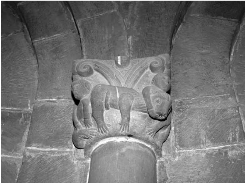
Capitel en la ermita de San Román de Castro.