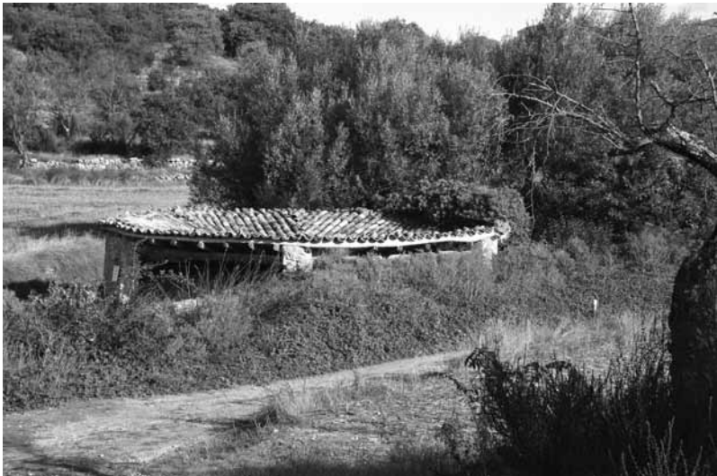
Llabadó de la Huerta.

desenterrá desenterrar desentoná desentonar desentrapá desentrampar desentrená desentrenar desesperá desesperar desfabá descapullar desfarchau, da larguirucho, de- saliñado desfarfallau, da deslenguado desfé deshacer, destruir, anular, cancelar; demoler; desbara- tar; disipar; desfé-se deshacer- se; desfé-se-ne desligarse de algo desferra avería, estropicio, da- ño, desastre, desperfecto, destrozo, destrucción, estra-