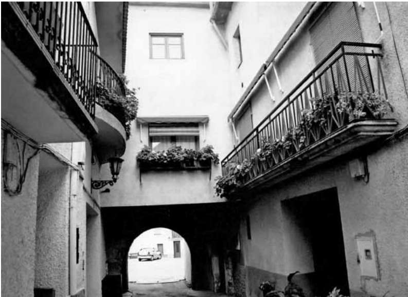
Cubierto de Olivera, en la calle del General Prim.