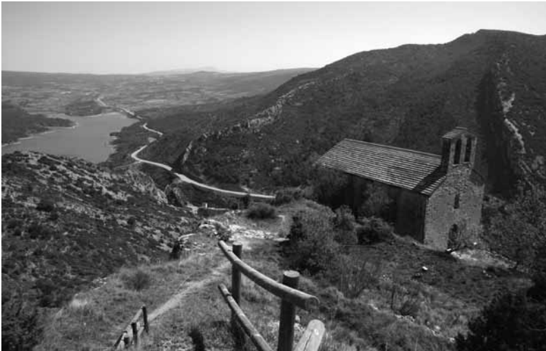
Ermita de San Román de Castro (siglo XI). Al fondo, el embalse de Barasona.