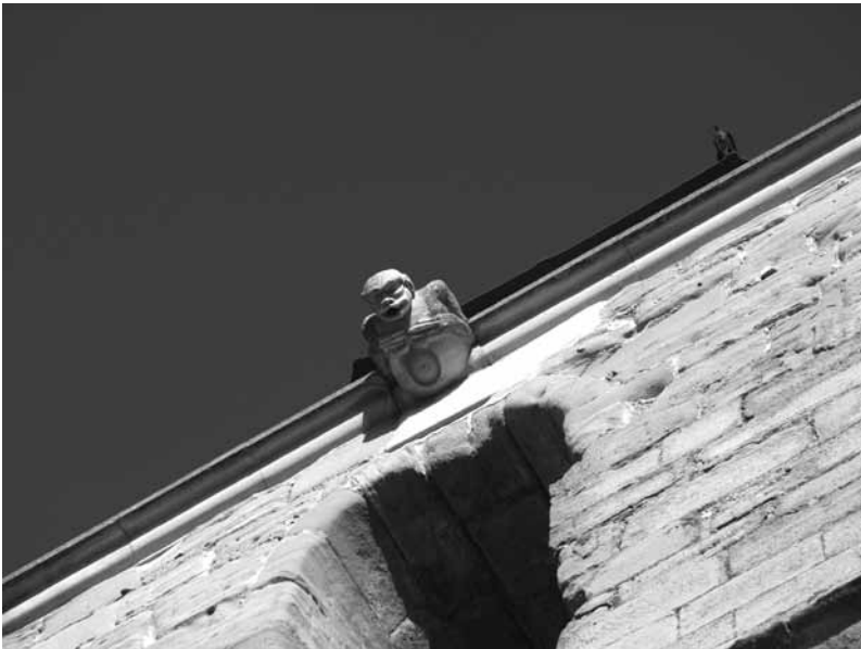
Gárgola de la iglesia parroquial.

divorciarse diborziá-se divulgar pregoná, dá a sabé doblar doblá, replegá, embolicá doblegar acojoná; doblegarse amollá-se, acojoná-se, reblá doblón dobleta dócil ben mandau docilidad obediencia doctrina dotrina dolencia doló doler fé mal; dolerse quejá-se dolor doló; dolor suave roña dolorido, a endoloríu