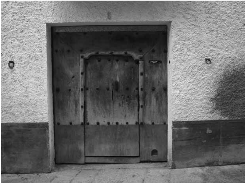
Puerta de casa Gaspá, en la calle Mayor.