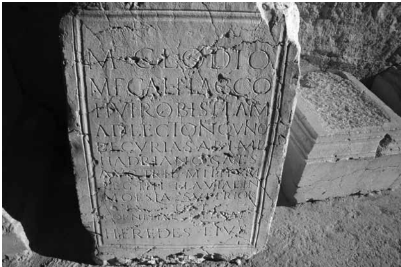
Inscripción honorífica dedicada a Marco Clodio Flaco en Labitolosa.