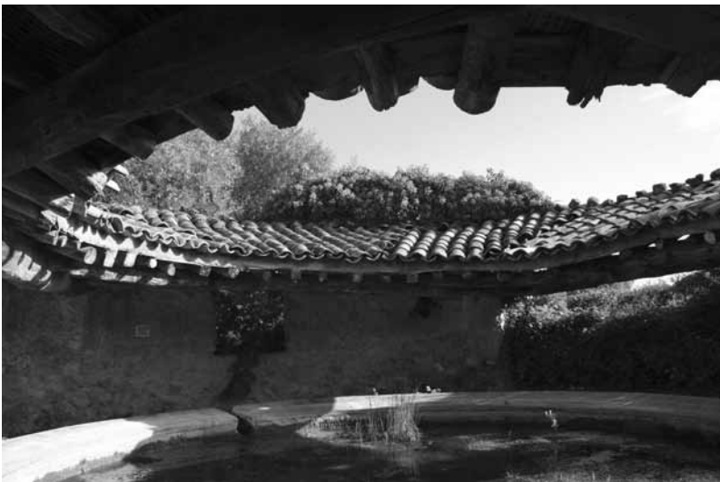
Llabadó de la Huerta.