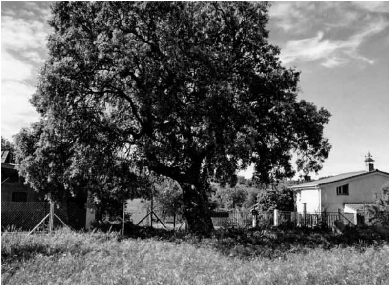
Carrasca de casa Miquel.