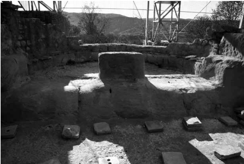
Vestigios de las termas romanas de Labillosa.