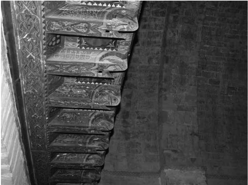
Artesonado mudéjar en el interior de San Román de Castro.