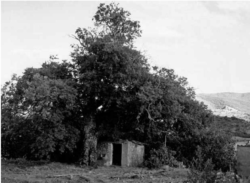
Lltonero de casa Romeu.