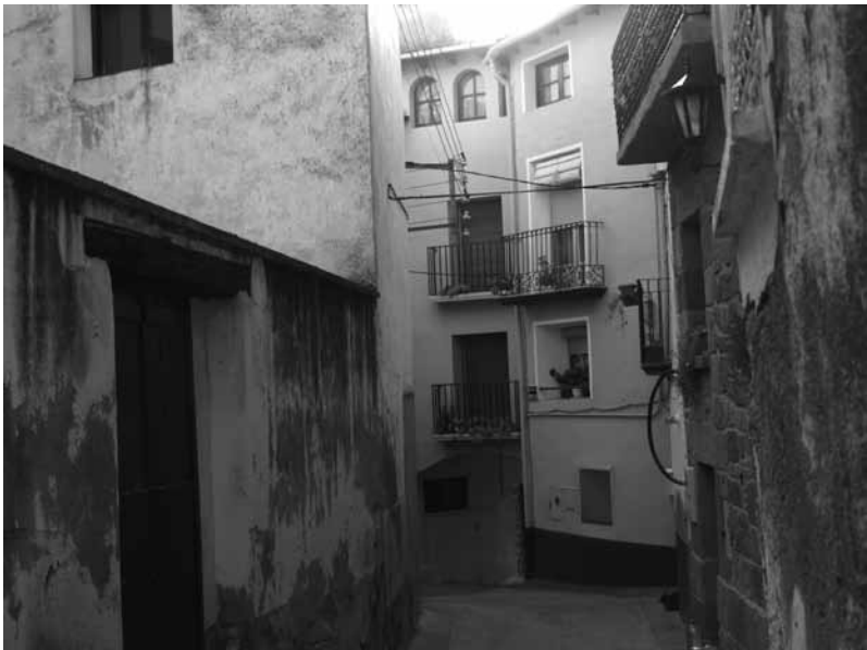
Calle del General Lacy.