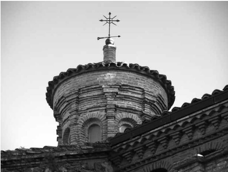
Detalle del exterior de la iglesia parroquial.