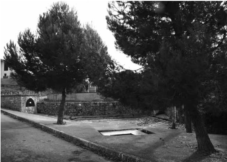
Llabadó y fuente de las Cañutas.