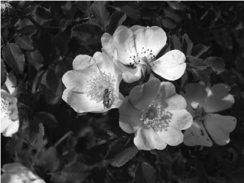
Garrabera o tapaculos (escaramujo).