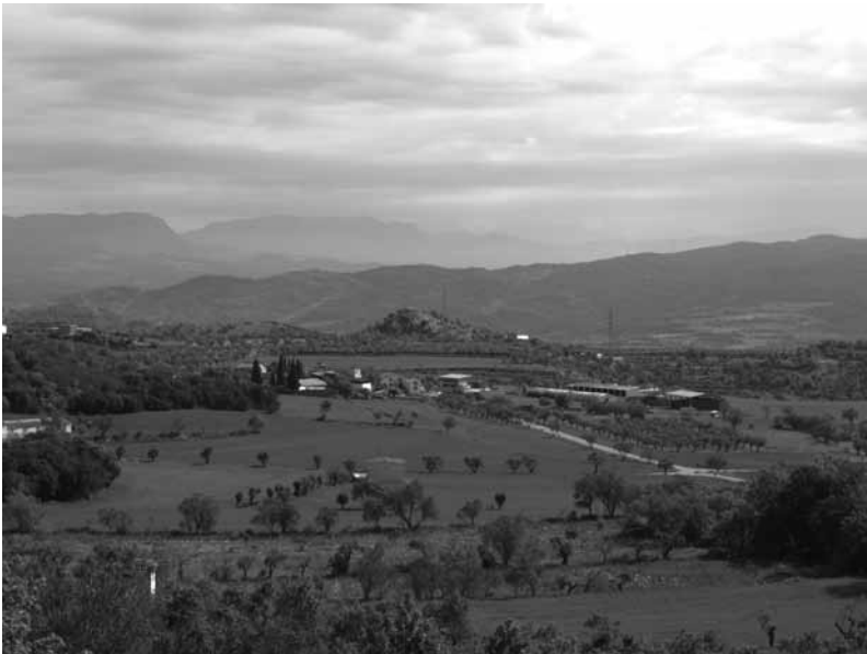
Vista del entorno de La Puebla de Castro.

roñá gruñir roñau, da herrumbroso roñido gruñido roñón, a regañón ropero salamanquesa rosera rosal; rosera borde escaramujo rosigá roer, rosigar rosigón cuscurro, corrusco, mendrugo rotá eructar, regoldar, regurgitar royo, a colorado, rojo, encarnado, rojizo royura en la piel pápula