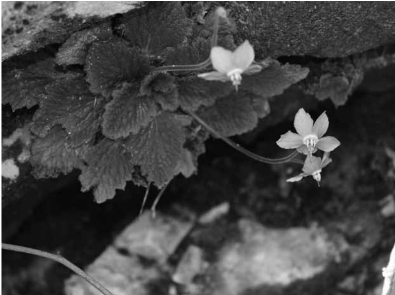
Yerba zerruda (oreja de oso), planta endémica del congosto de Olvena.