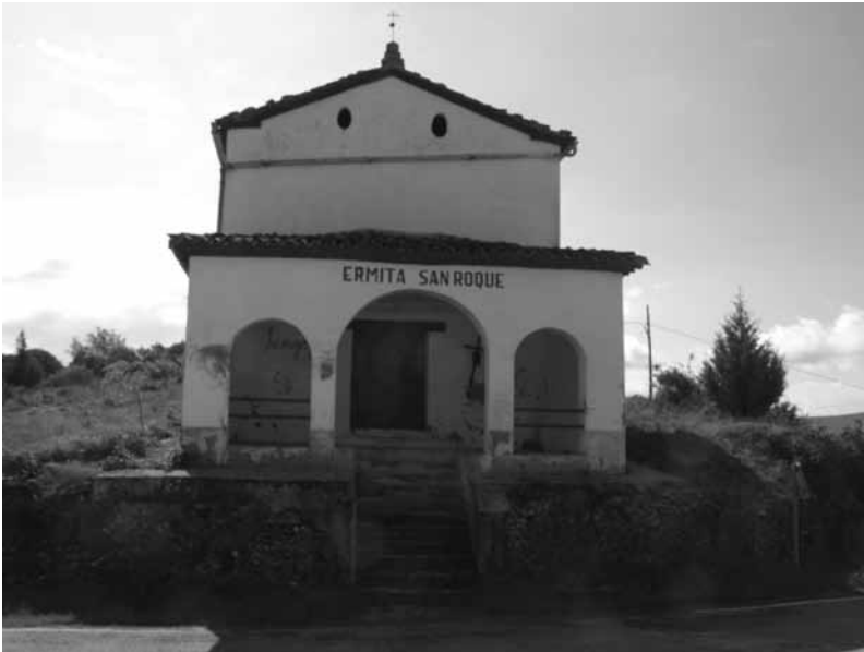
Ermita de San Roque.

incendiar abrasá, pegá fuego incitar engrescá, enzorizá inclinár decantá, abocá incluir meté, enjaretá incluso tamé incordiador, a amoladó incordiar amolá, jibá incrédulo, a descreíu incrustar clabá, embutí incubar encobá, apollá inculto torrocudo incumbir pertenezé incurrir caé indagar rebuscá