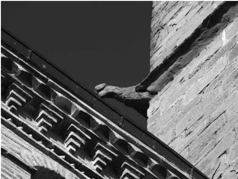
Alero y gárgola de la iglesia parroquial.