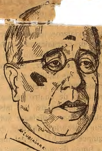
El ilustre ex presidente del Consejo de Ministros, don Manuel Azaña y Díaz, a quien en este día de su onomástica, felicitará la España republicana

Senáramos que no nos proporcionasen pronto motivos para aplicarles otra taza y media de caldo.