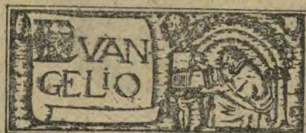
Domingo V después de Pentecostés. (San Mateo, V, 20-24)

«Si vuestra justicia no es más llena y mayor que la de los escribas y fariseos no entraréis en el reino de los cielos».