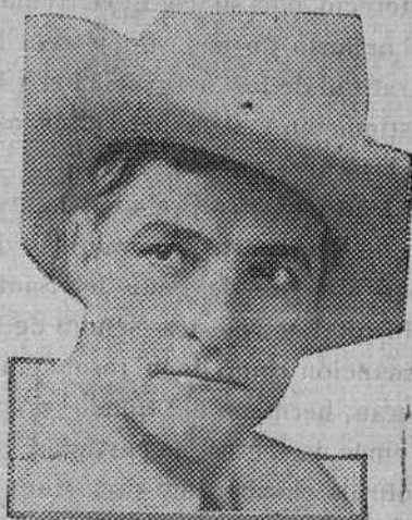
TOM MIX - FOX FILMS

Dan Clark, quien ha fotografiado cerca de veintemil metros de película de Tom Mix, dice que no hay muchos hombres que aparezcan ante la cámara fotográfica, conociendo las limitaciones y alcance del misterioso aparato, tan a fondo como este celebrado astro de aventuras Tom Mix dice Clark conoce a perfección las diversas dificultades que afrontan al fotógrafo en la filmación de una película.