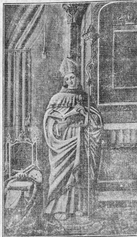
SAN LUIS OBISPO DE TOLOSA

El rey, que había seguido oculta- mente los pasos de su hijo, admiró la escena entre afectos de estupor y devoción; sintió crecer en su corazón el amor y veneración que profesaba a su querido Luis; cubriéndole luego de besos mientras hablando con él sondea-