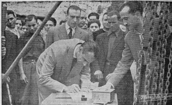
El Jefe Provincial del Movimiento coloca la primera piedra de un almacén-granero en su pueblo natal, Alacón.