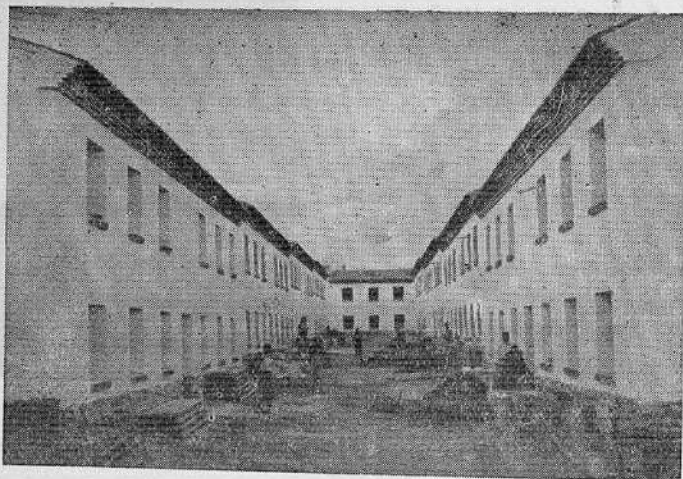
Grupo de viviendas sindicales, «Generalísimo Franco», en Teruel