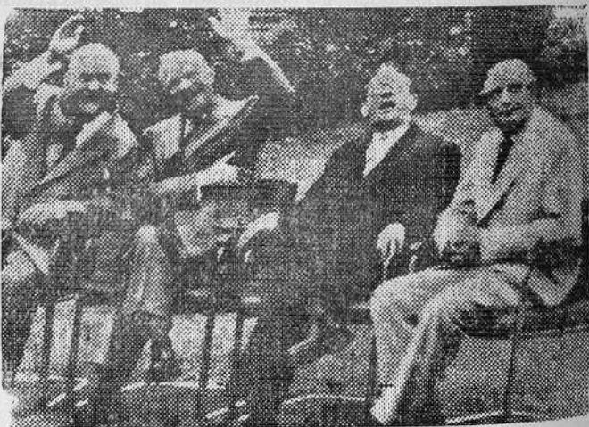
Los «cuatro grandes» reunidos en Ginebra

En esa atmósfera de euforia, contando además con las continuas protestas rusas de un pretendido pacifismo y deseos de «coexistir», se reúnen los cuatro grandes en Ginebra. Todo parece que induce a creer en una rectificación rusa y que la guerra fría ha de cesar prontamente. Surge una nueva frase: «El espíritu de Ginebra», que significa o quiere significar tanto como comprensión mutua. Sólo hay un pequeño escollo: la reunificación alemana; pero los «cuatro» se separan en Ginebra con la esperanza, bastante firme, de que los ministros de Asuntos Exteriores, en una ulterior conversación, lleguen a un acuerdo.