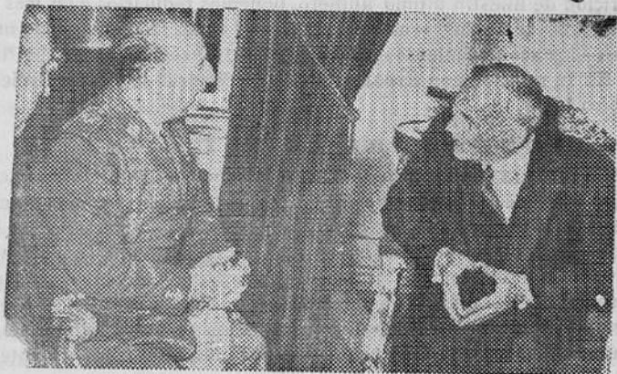
Entrevista de Franco con Foster Dulles

Destacado acontecimiento, en las relaciones de España y el Mundo, ha sido la visita del secretario de Estado norteamericano a Madrid, durante la pasada y fracasada conferencia de Ginebra. Se ha dicho por los más conspicuos comentaristas extranjeros que esta visita de Foster Dulles al Palacio de El Pardo, tenía mucha más importancia que los resultados de la misma conferencia ginebrina.